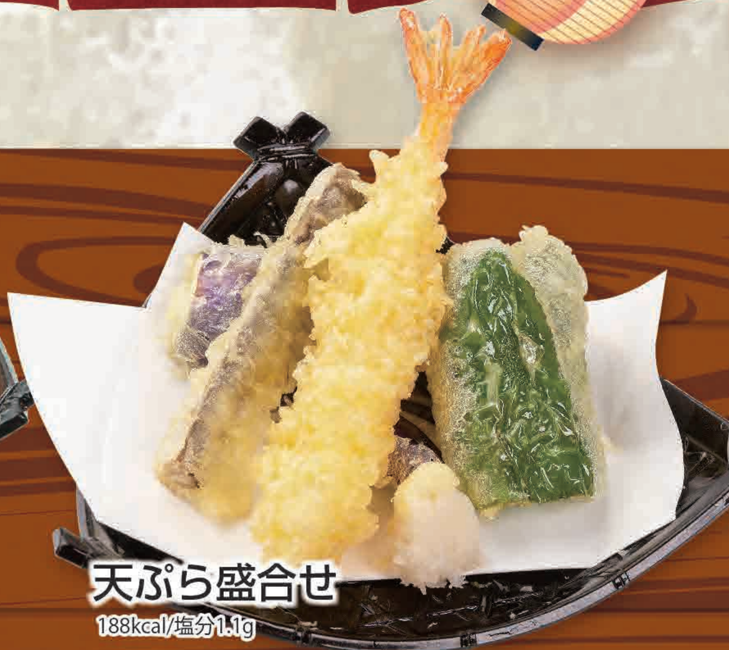
天ぷら盛合せ 188kcal/塩分1.1g