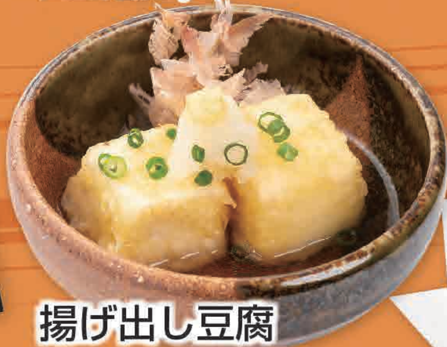
揚げ出し豆腐 186kcal/塩分1.1g