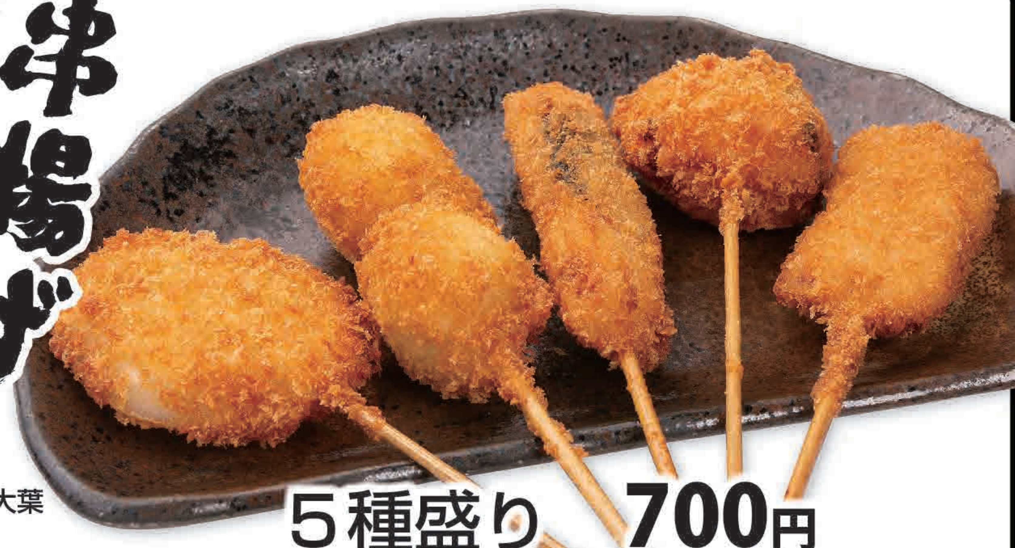
5種盛り 700円 (税込770円) 262kcal/塩分0.1g