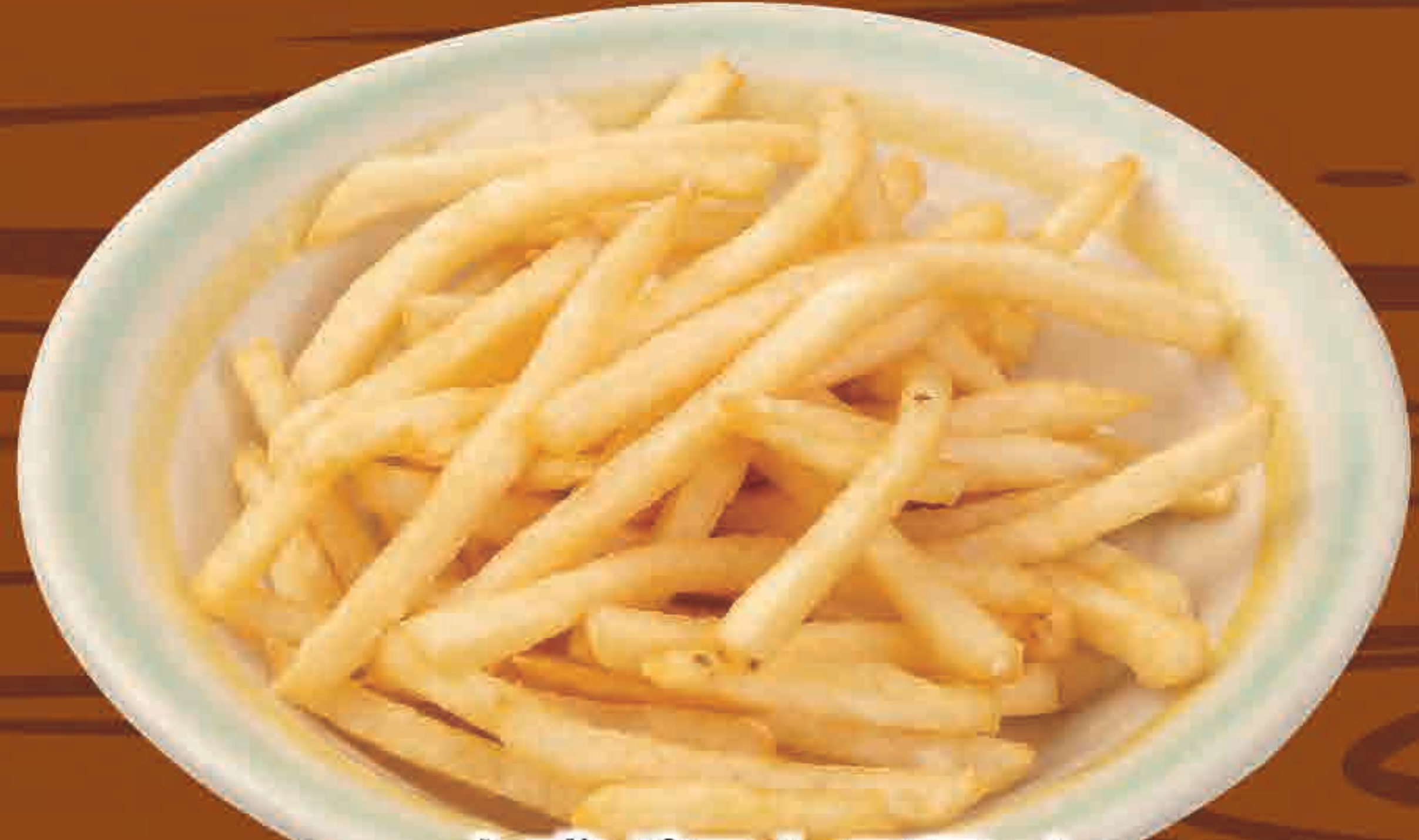
大盛ポテトフライ 466kcal/塩分2.8g