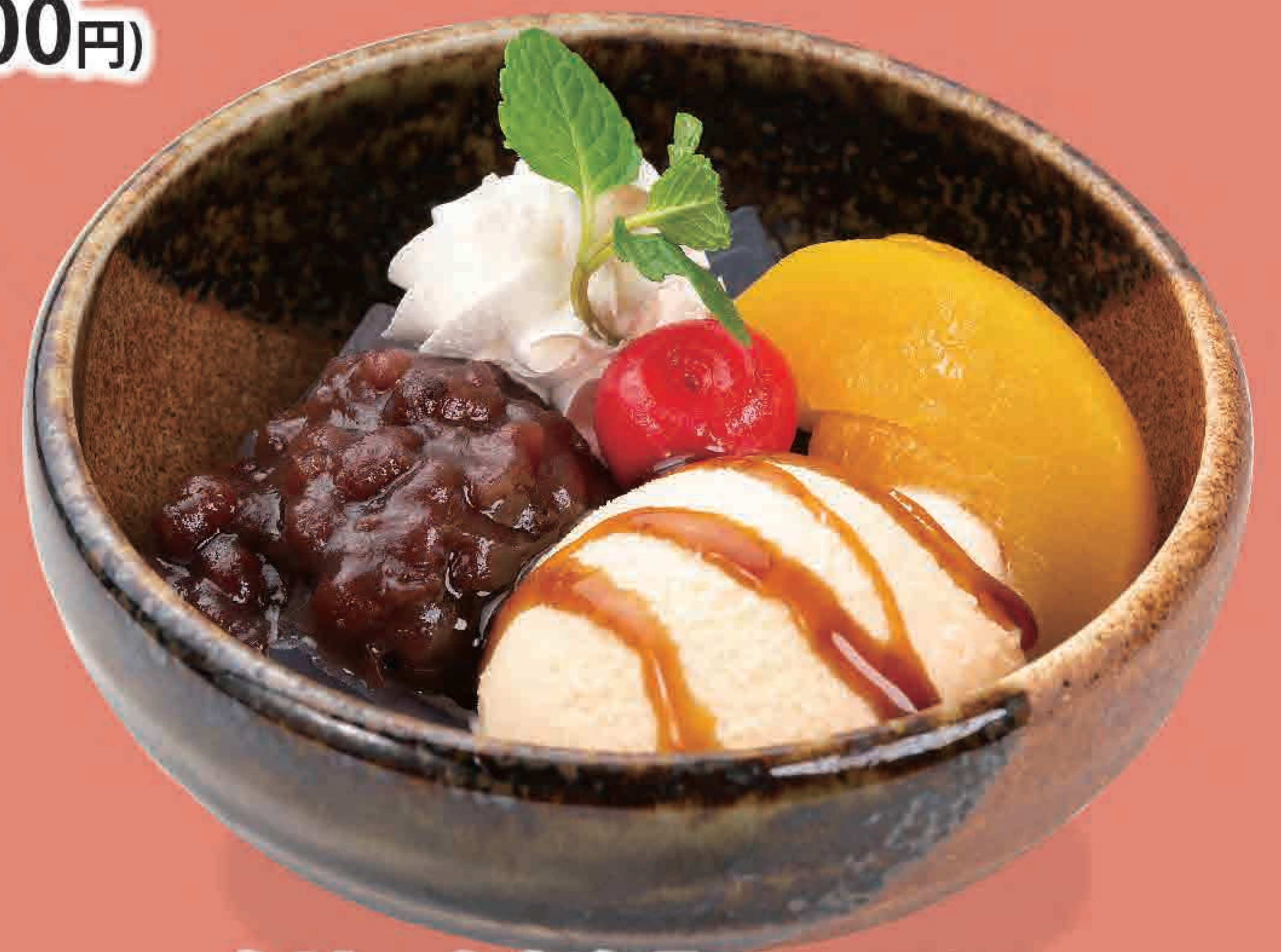
クリームあんみつ 591円 (税込650円) 353kcal/塩分0.3g