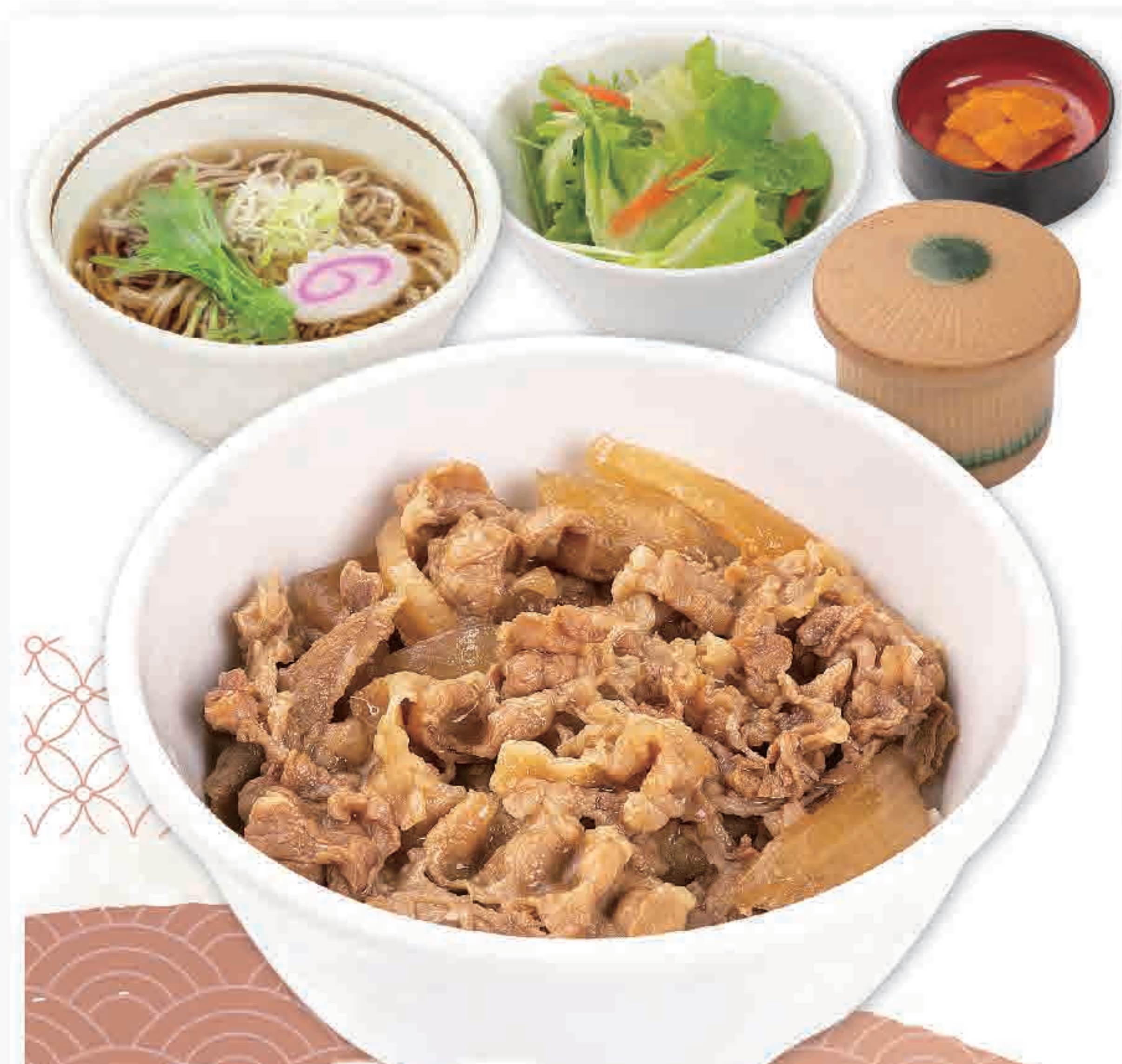
ミニ牛丼 ミニそばセット 837円 (税込920円)