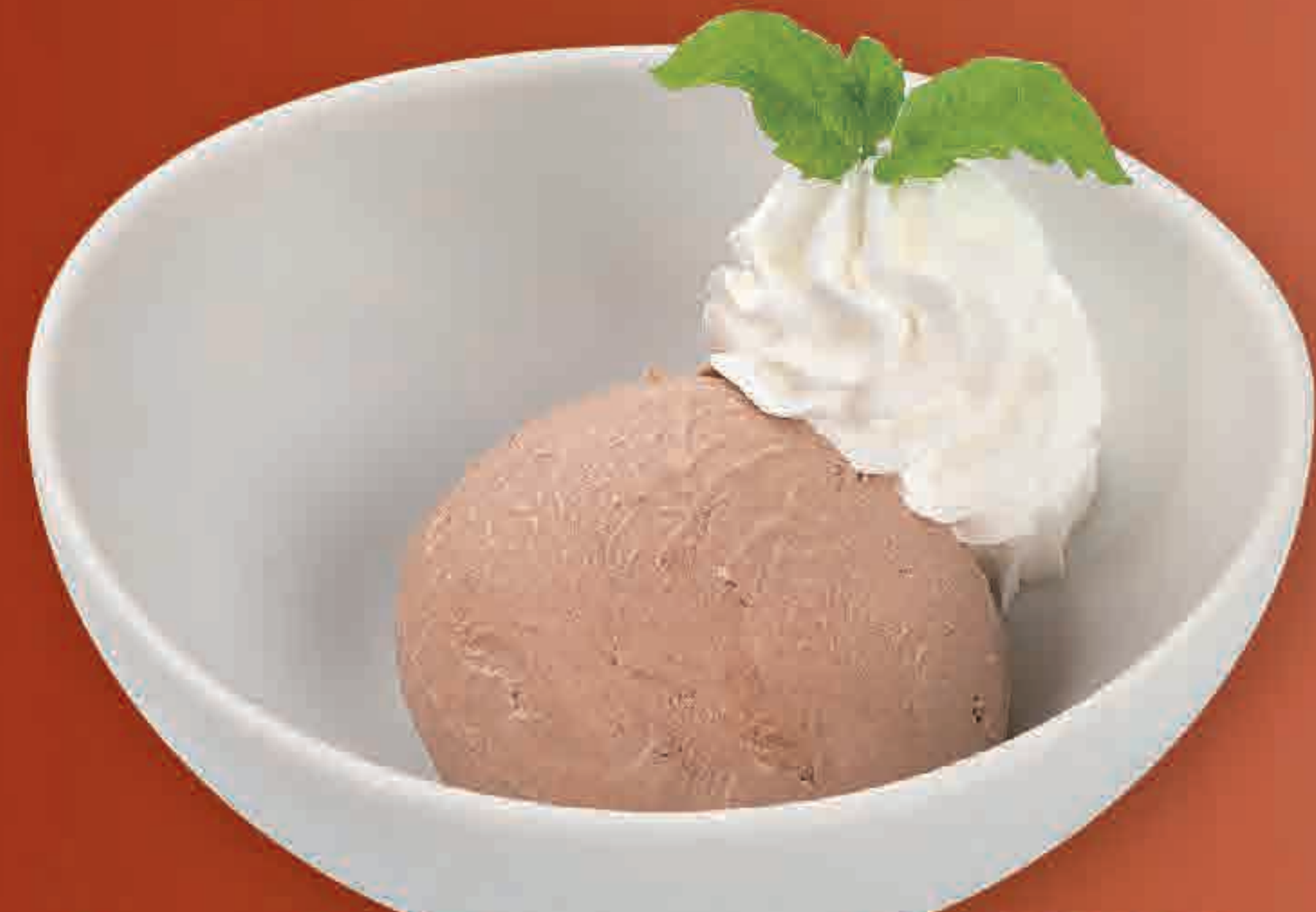
チョコレートアイス 191円 92kcal/塩分0.0g (税込210円)