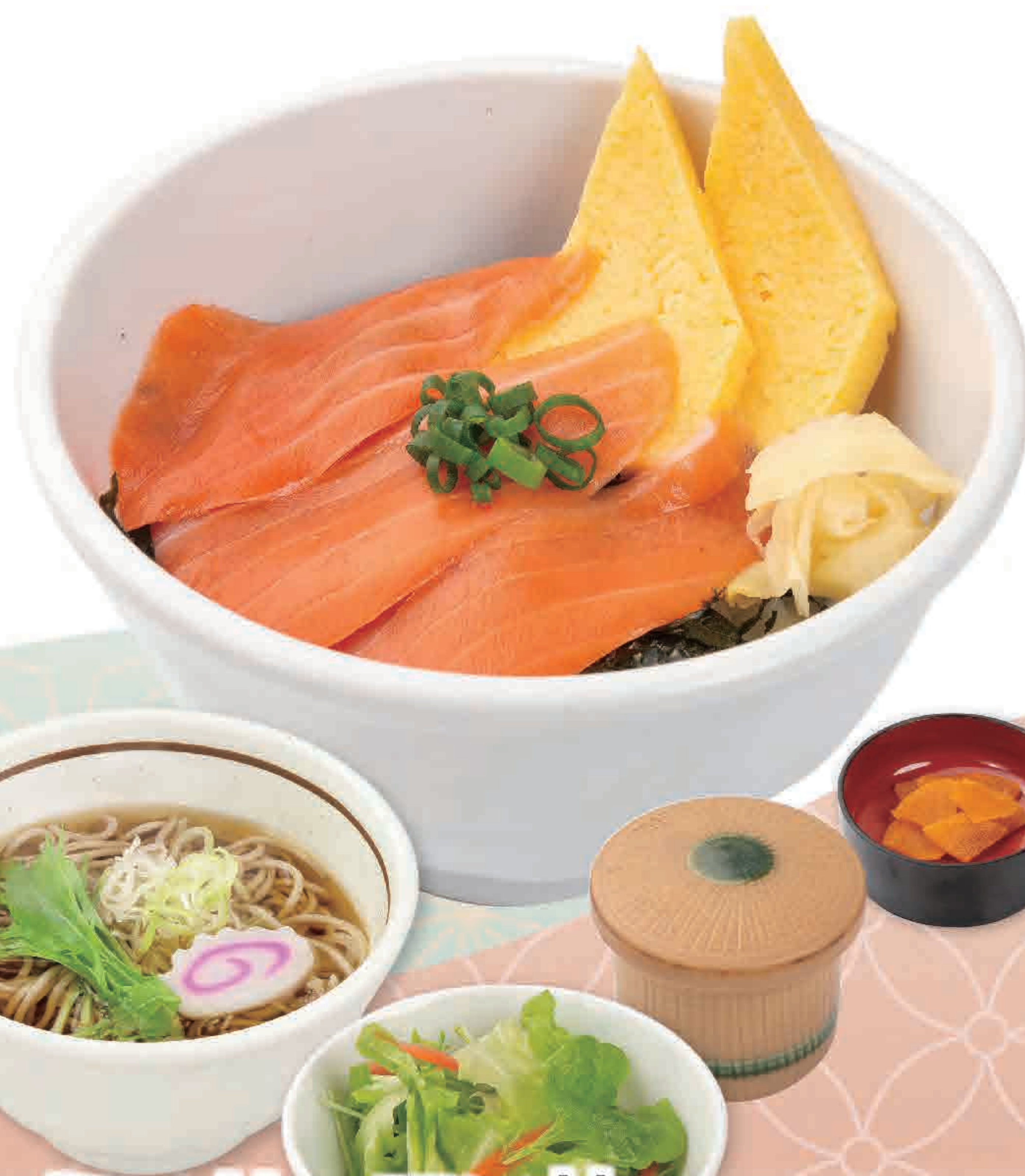
ミニサーモン丼 ミニそばセット 828円 (税込910円)