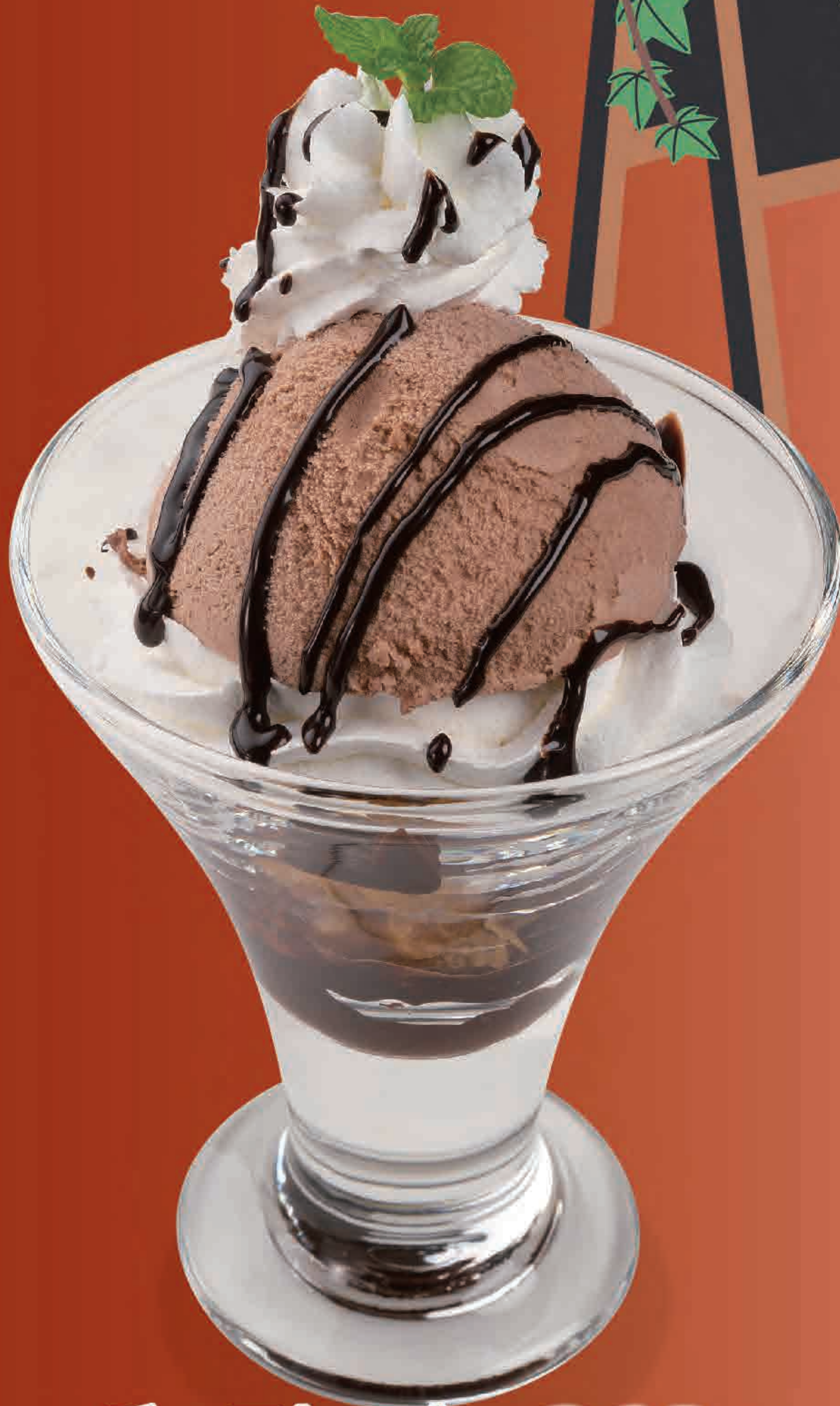
チョコレート サンデー 364円 (税込400円) 210kcal/塩分0.2g