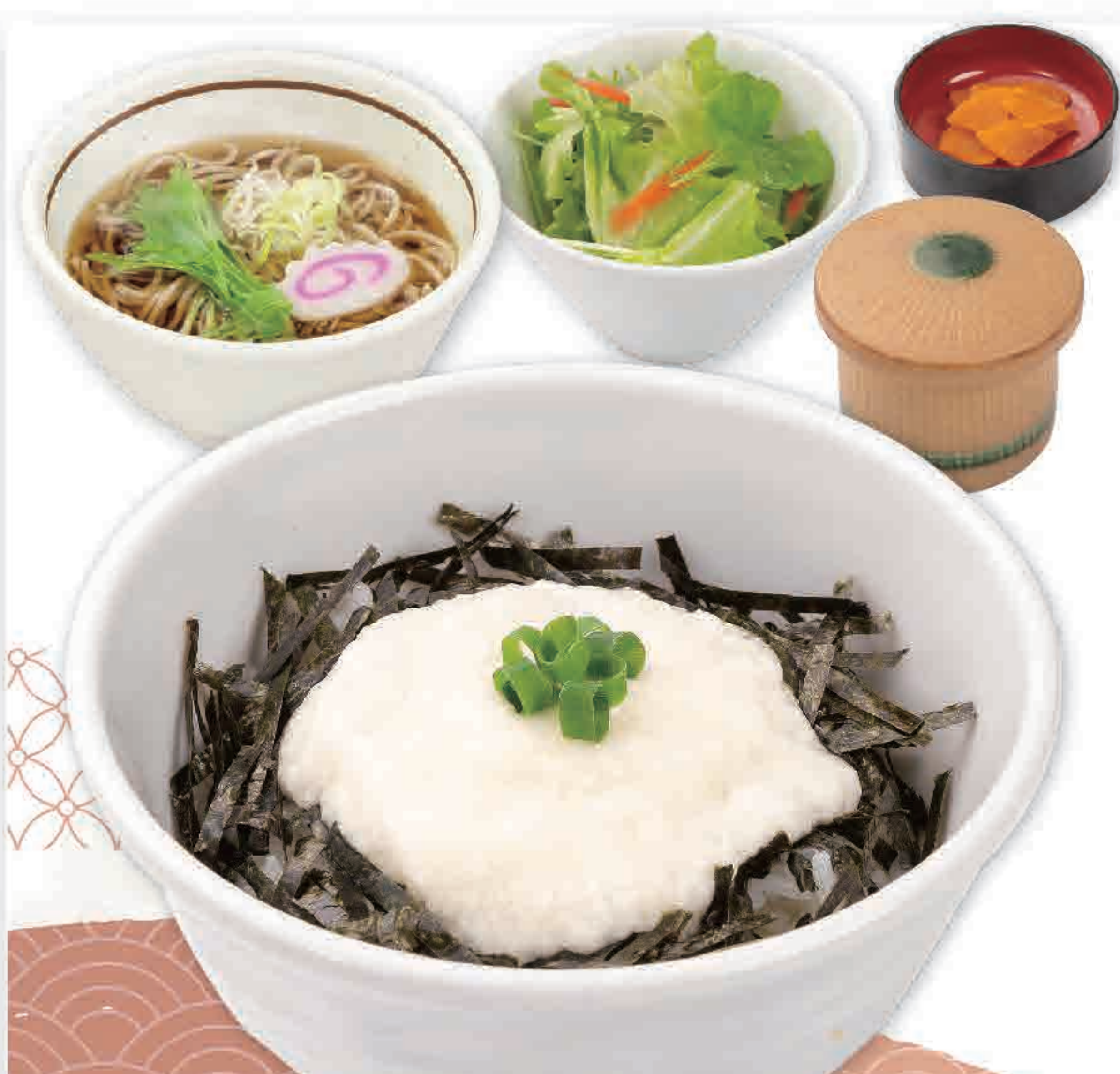
ミニとろろ丼 ミニそばセット 746円 (税込820円)