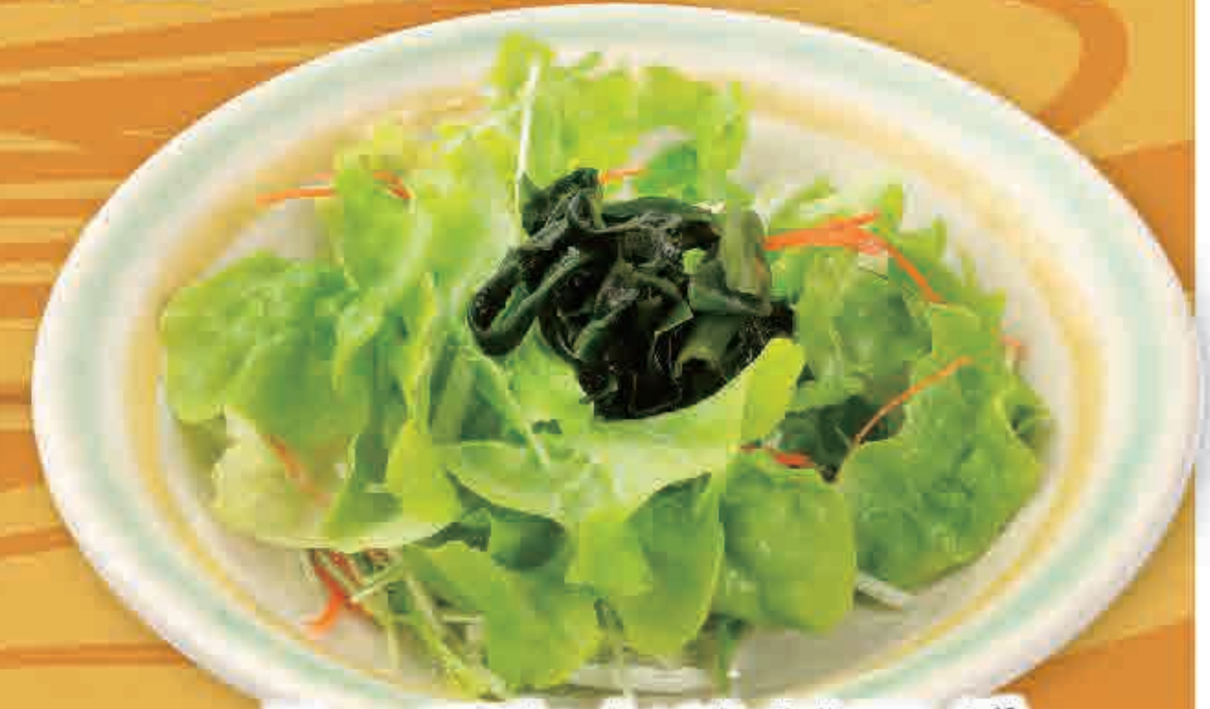
ハーフわかめサラダ 18kcal/塩分1.4g