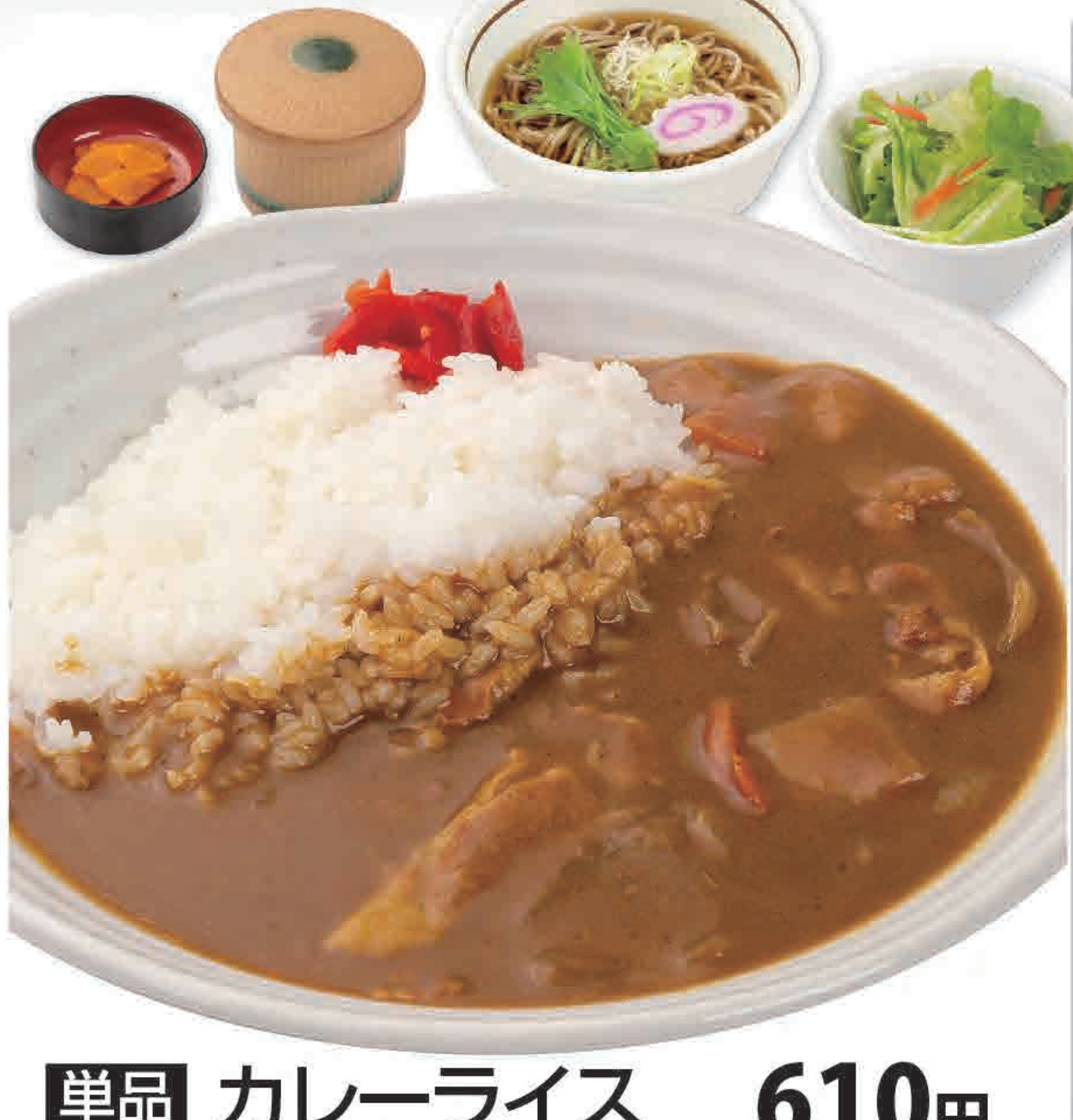
单品 カレーライス 610円 642kcal/塩分4.1g (税込670円)