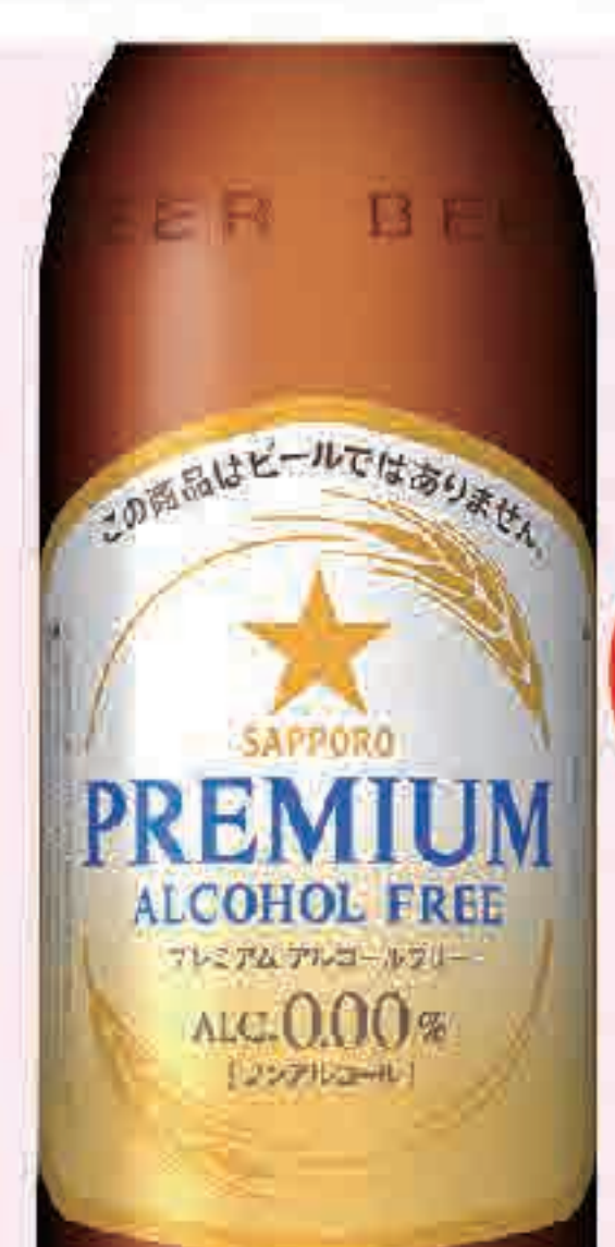
プレミアム アルコール フリー 273円 (税込300円)