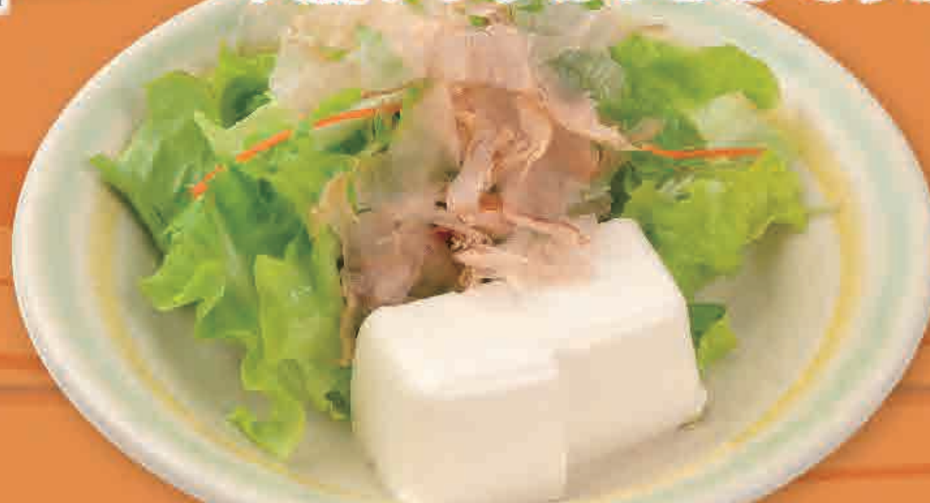
ハーフ豆腐サラダ 128kcal/塩分0.9g