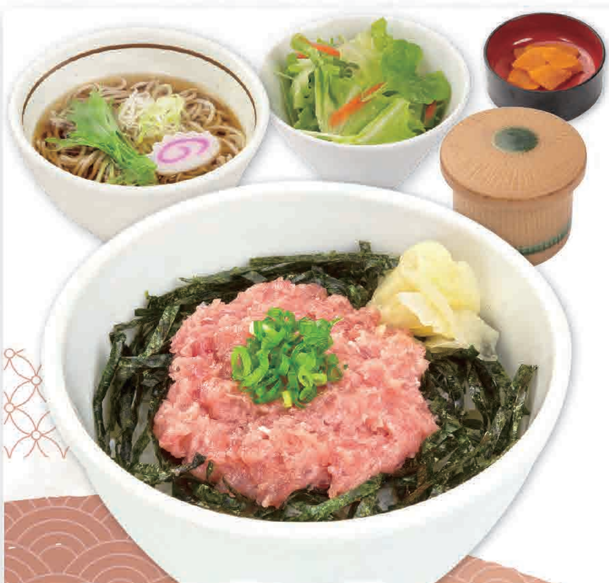
ミニネギトロ丼 ミニそばセット 919円 (税込1,010円)