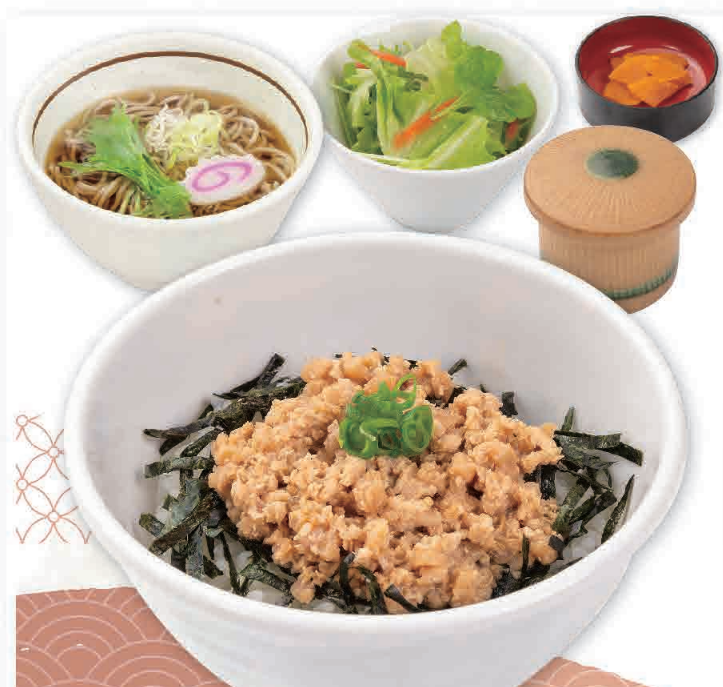
ミニ鶏そぼろ丼 ミニそばセット 746円 (税込820円)