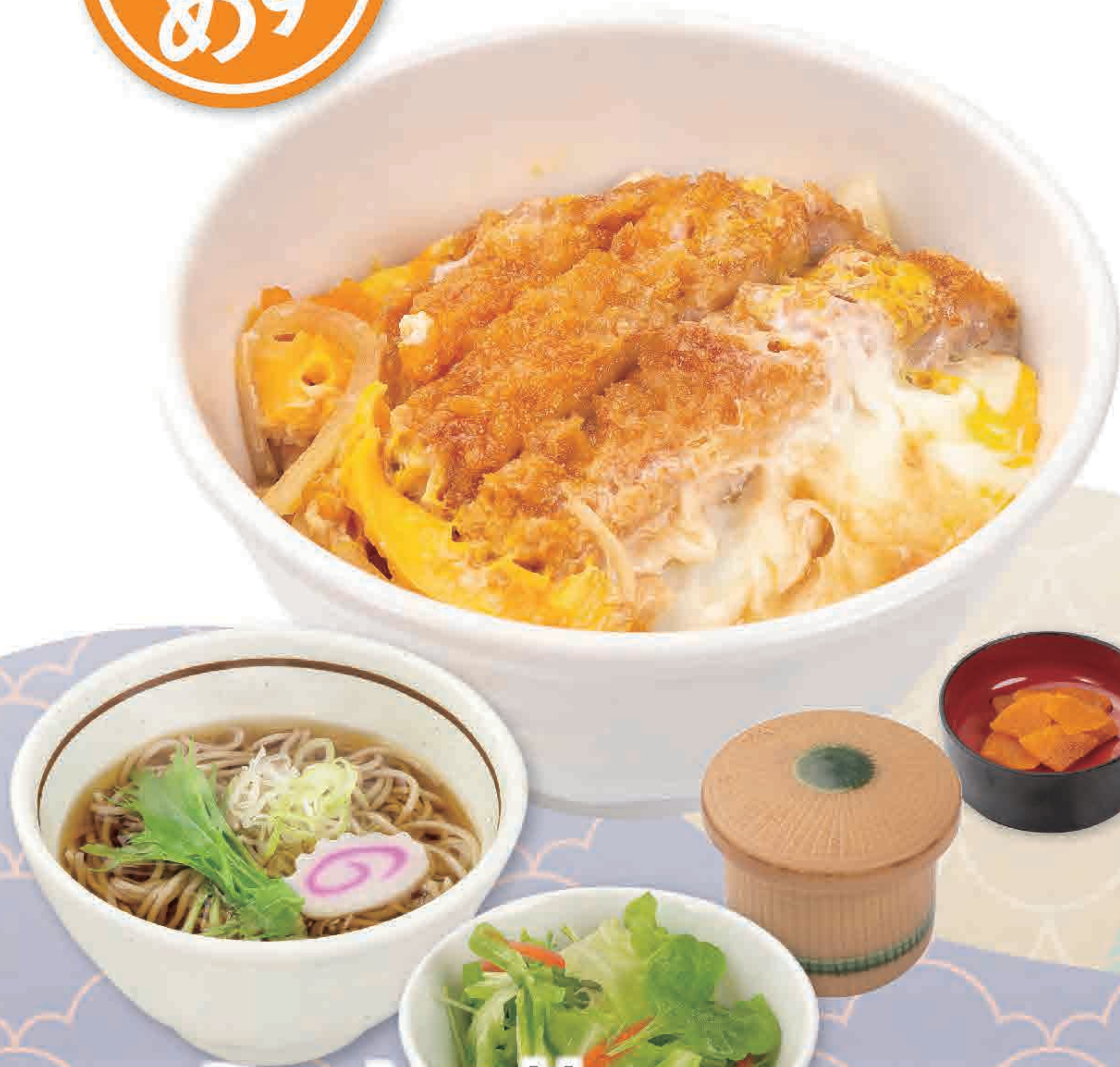
ミニかつ丼 ミニそばセット 891円 (税込980円)