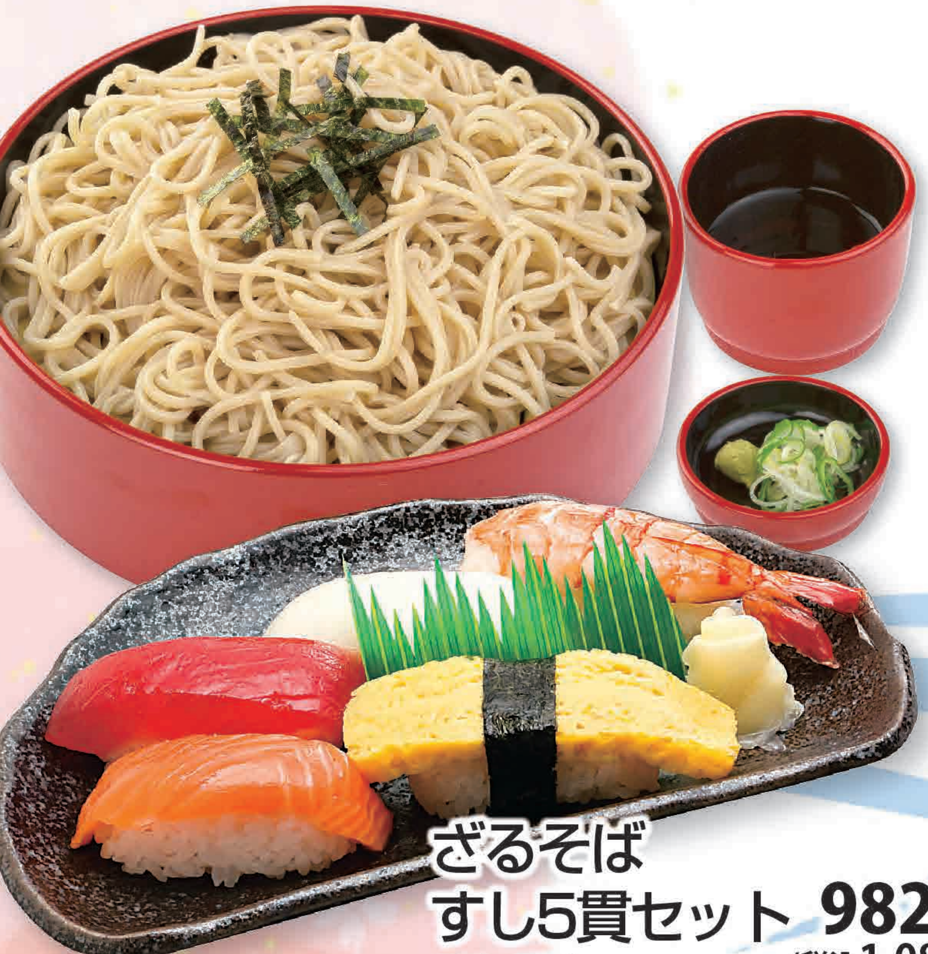
ざるそば すし5貫セット 982円 597kcal/塩分4.5g (税込1,080円) ●ざるそばのつゆ(1人前) 90cc/塩分2.6g