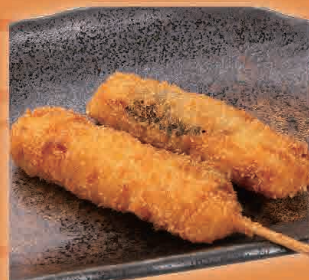
鶏ささみ大葉 97kcal/塩分0.0g