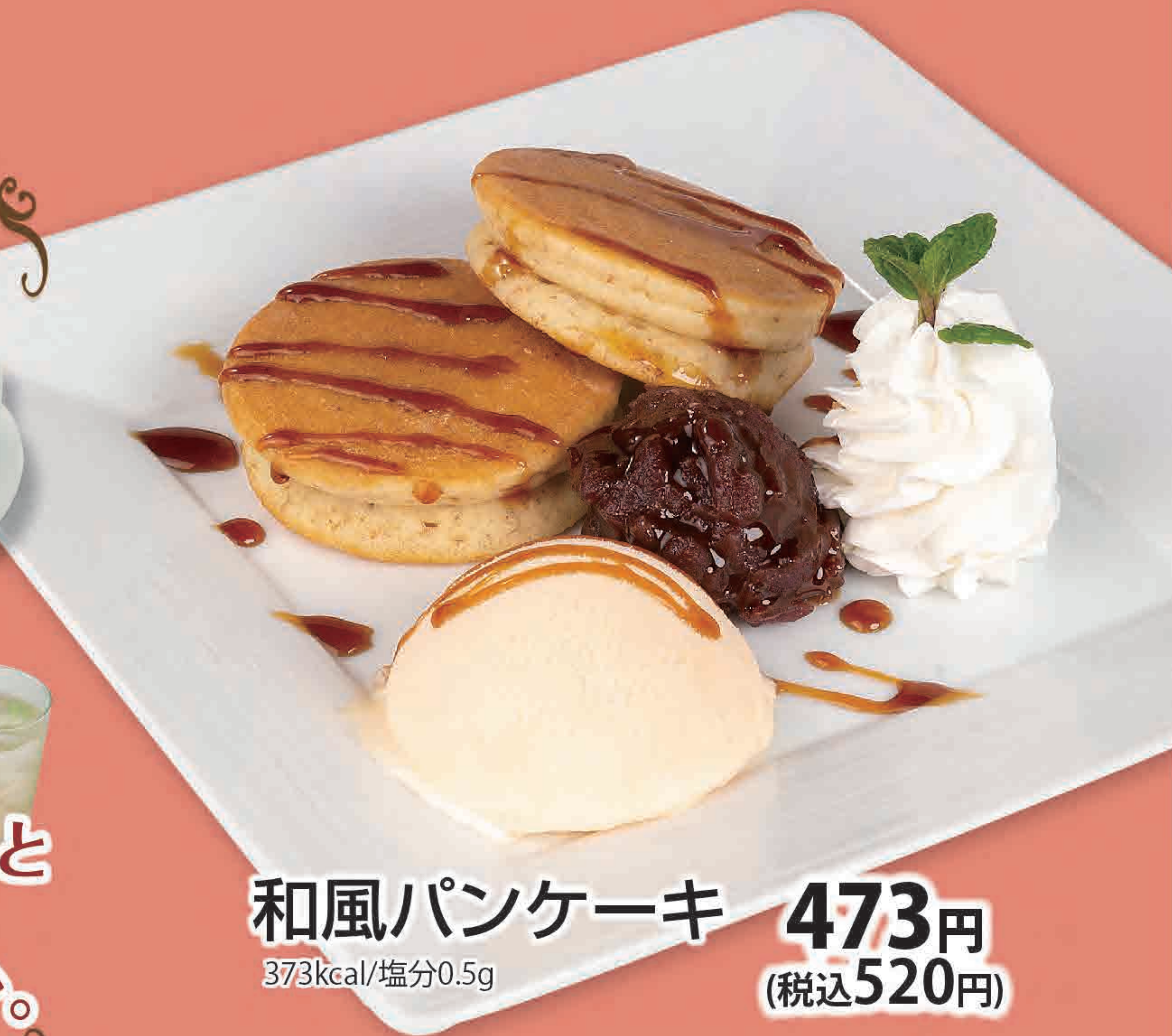
和風パンケーキ 473円 373kcal/塩分0.5g (税込520円)