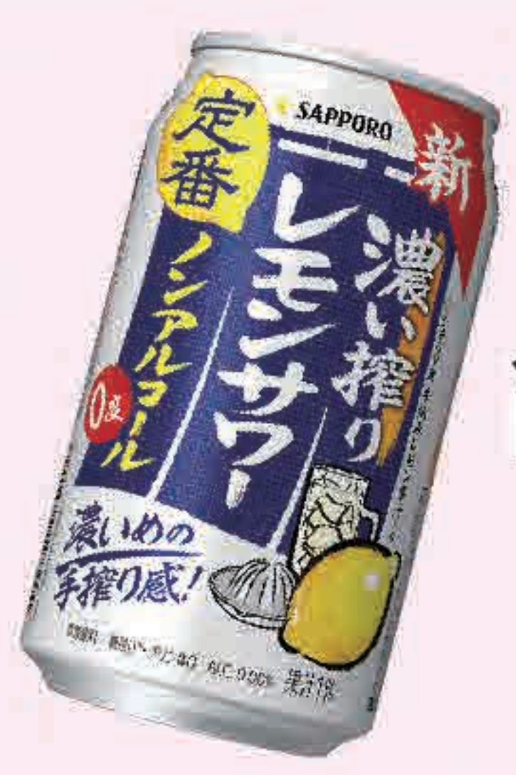
ノンアル レモンソーダ 273円 (税込300円)