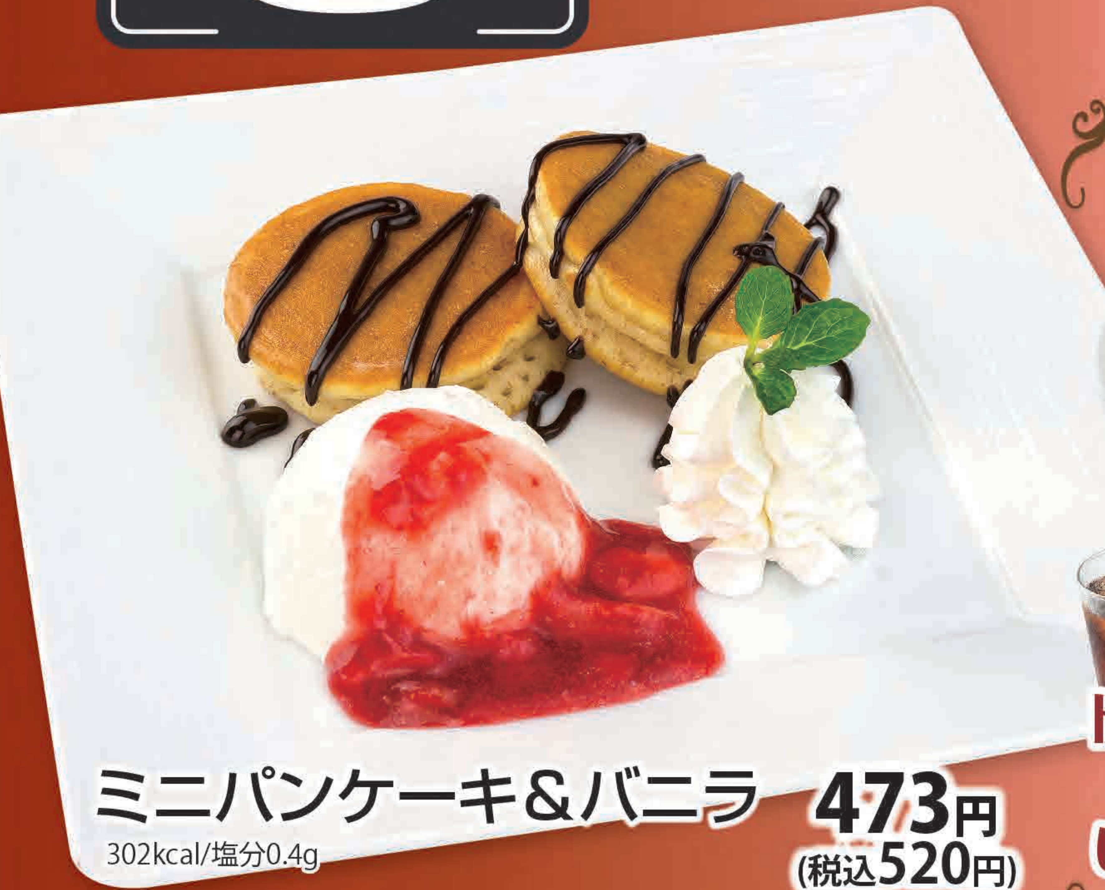
ミニパンケーキ&バニラ 473円 302kcal/塩分0.4g (税込520円)