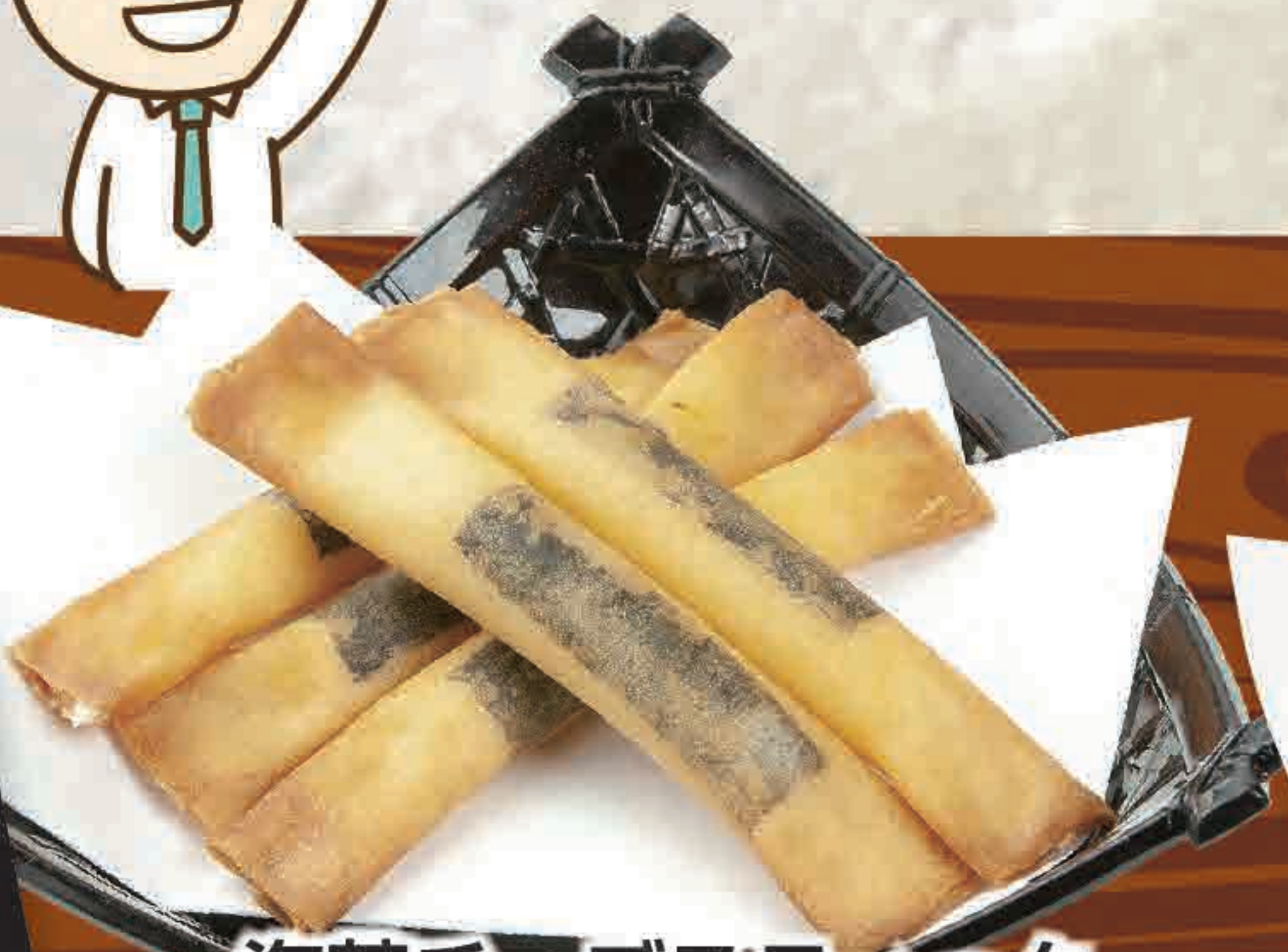
海苔チーズスティック 195kcal/塩分1.0g