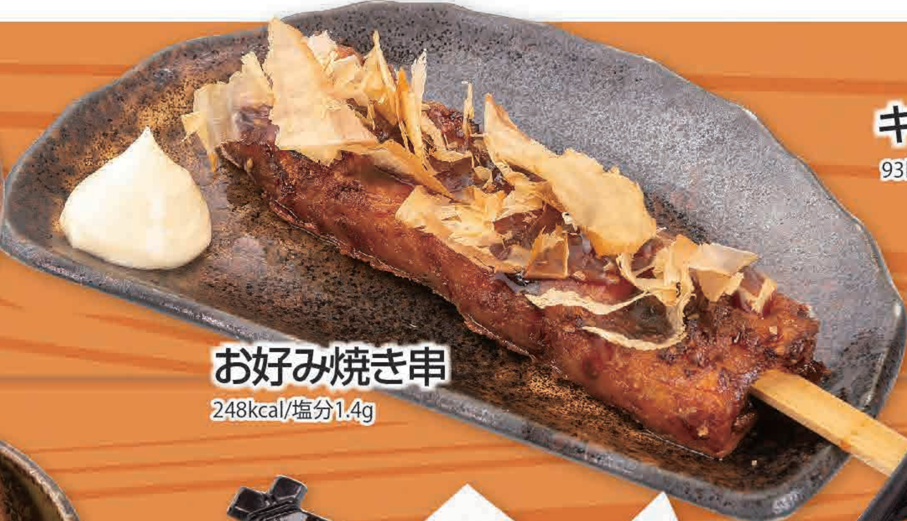
お好み焼き串 248kcal/塩分1.4g