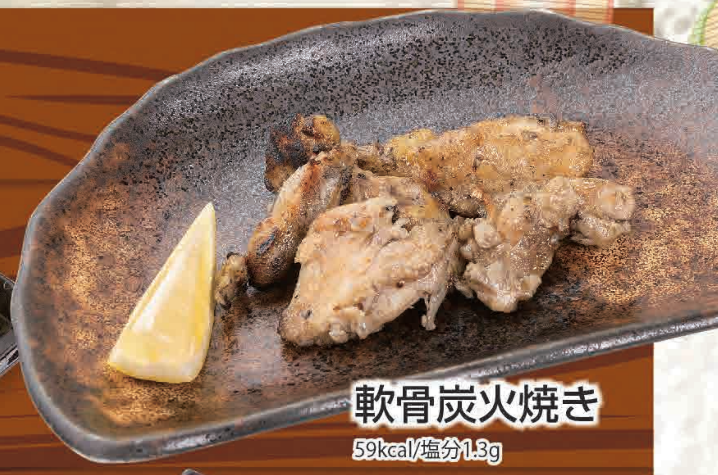
軟骨炭火焼き 59kcal/塩分1.3g