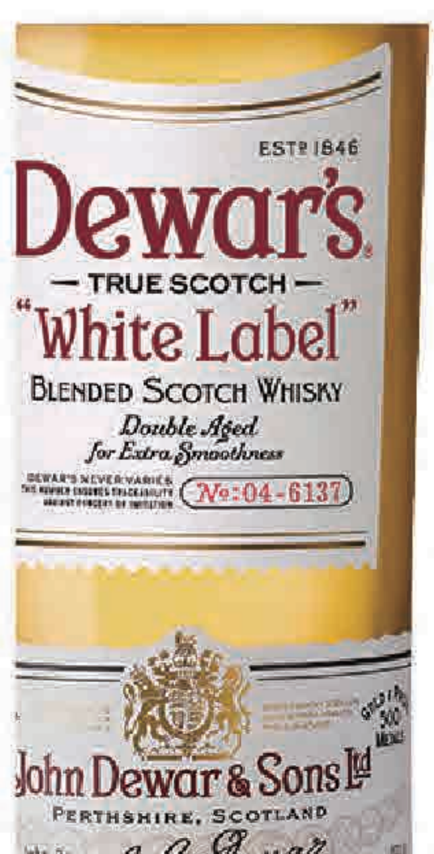
ウィスキー デュワーズ (グラス) 437円 (税込480円) (ボトル) 2,728円 (税込3,000円)