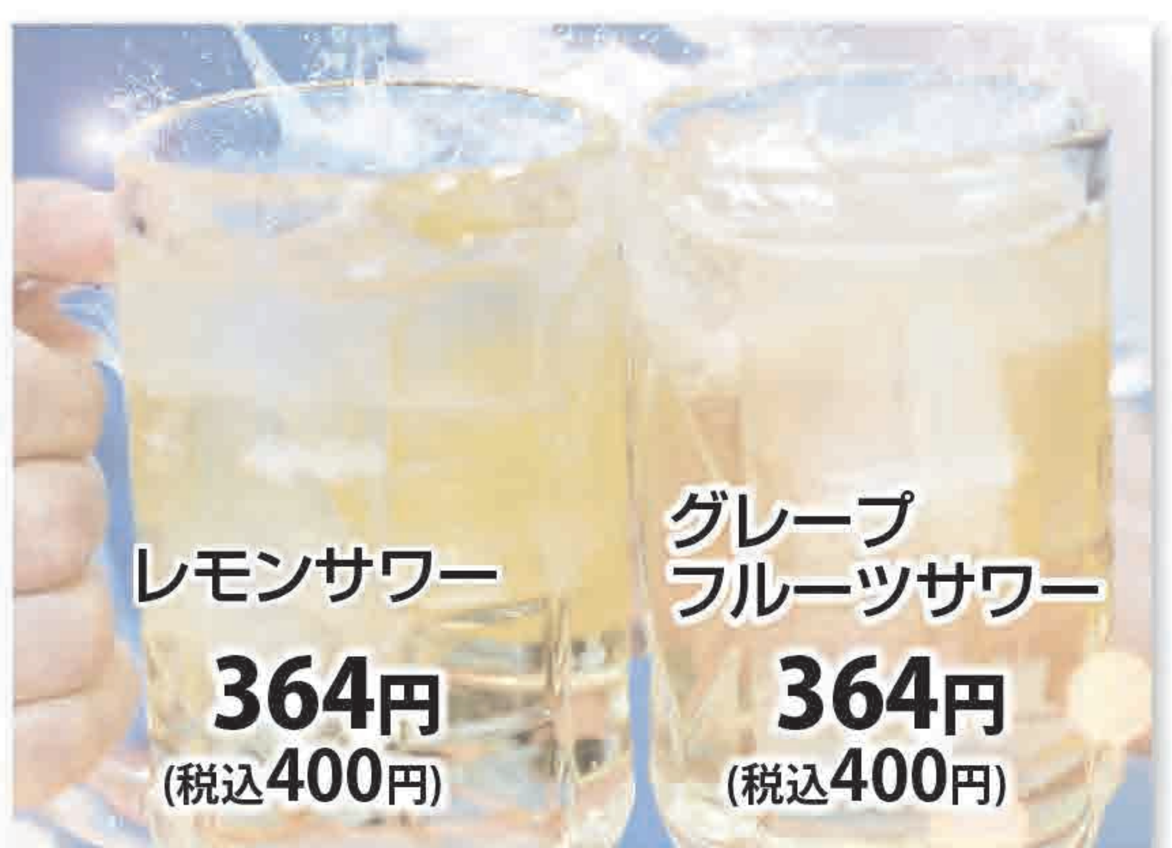
レモンソーダ 364円 (税込400円)