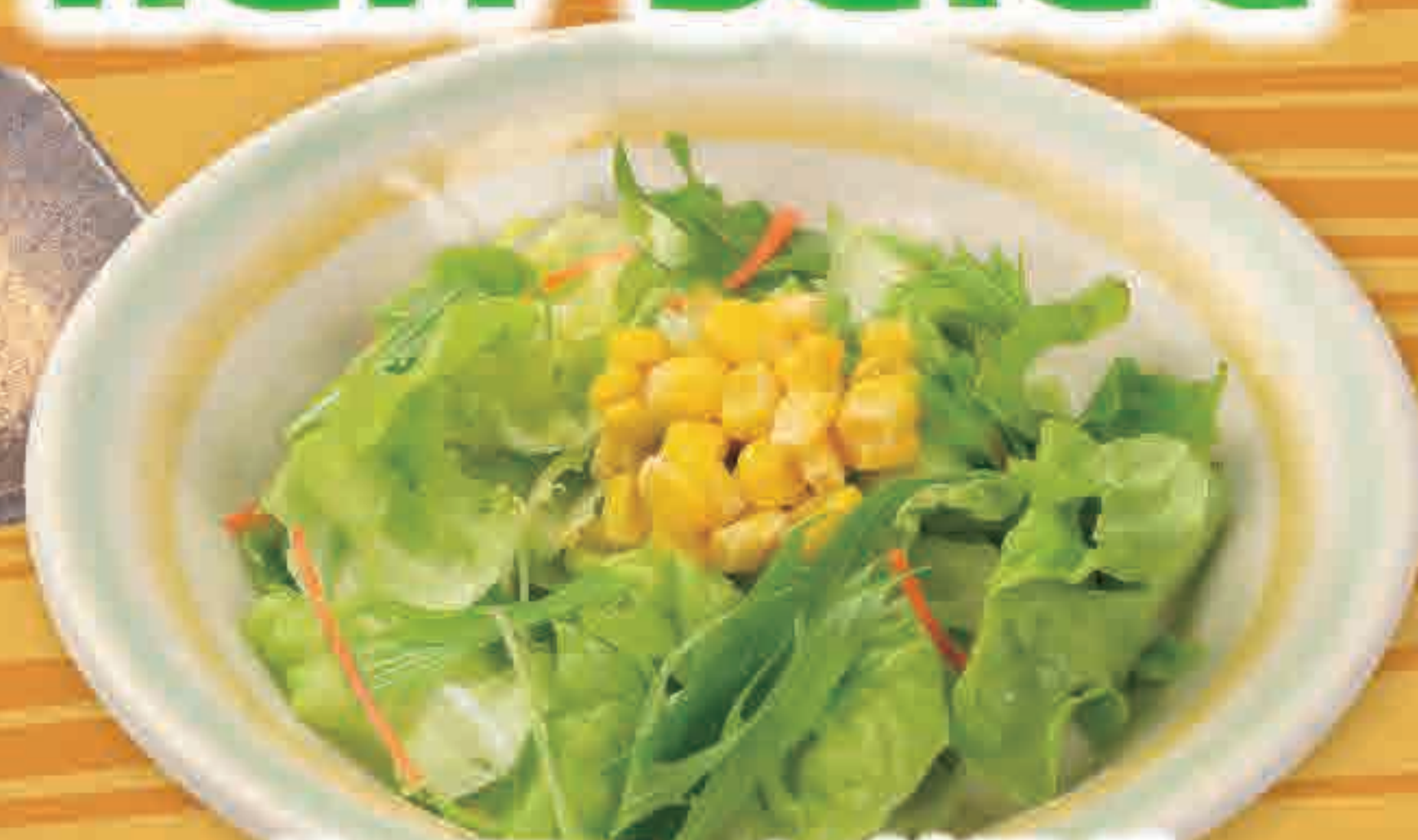
ハーフコーンサラダ 27kcal/塩分1.3g