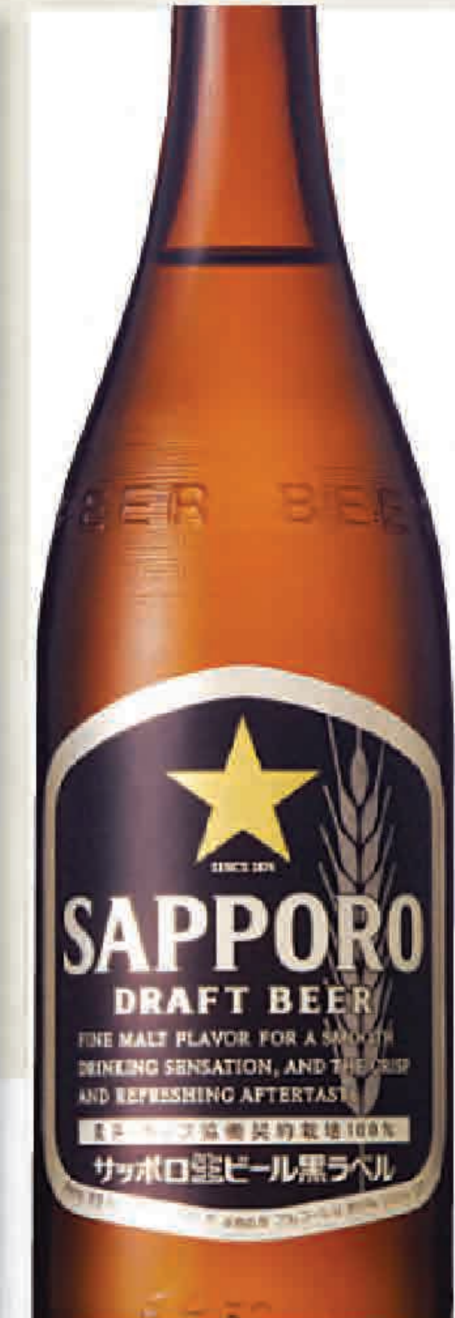
サッポロ 黒ラベル (中瓶) 455円 (税込500円)