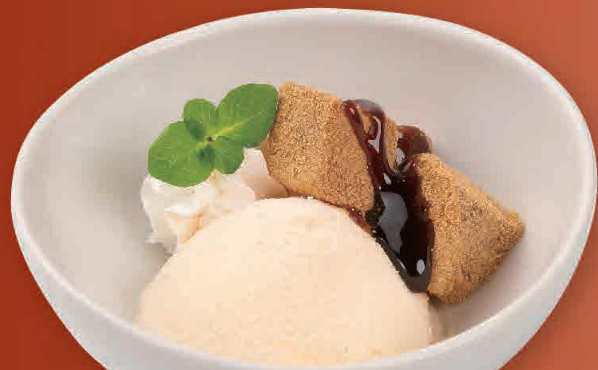
わらびもちバニラ 291円 176kcal/塩分0.1g (税込320円)