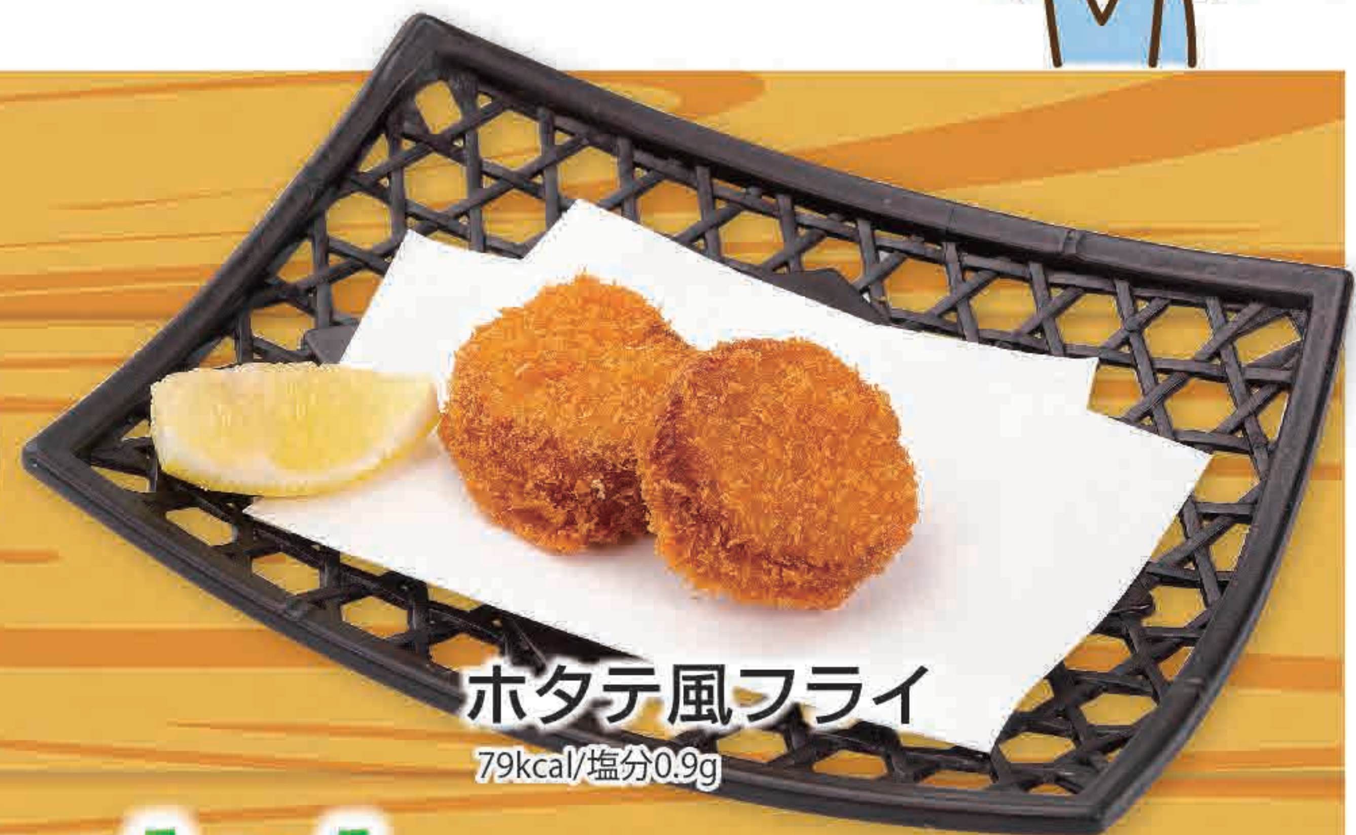
ホタテ風フライ 79kcal/塩分0.9g