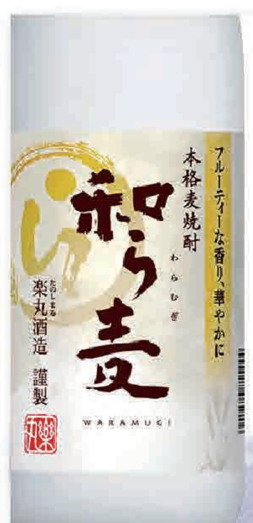
むぎ焼酎 和ら麦 (グラス) 437円 (税込480円) (ボトル) 2,728円 (税込3,000円)