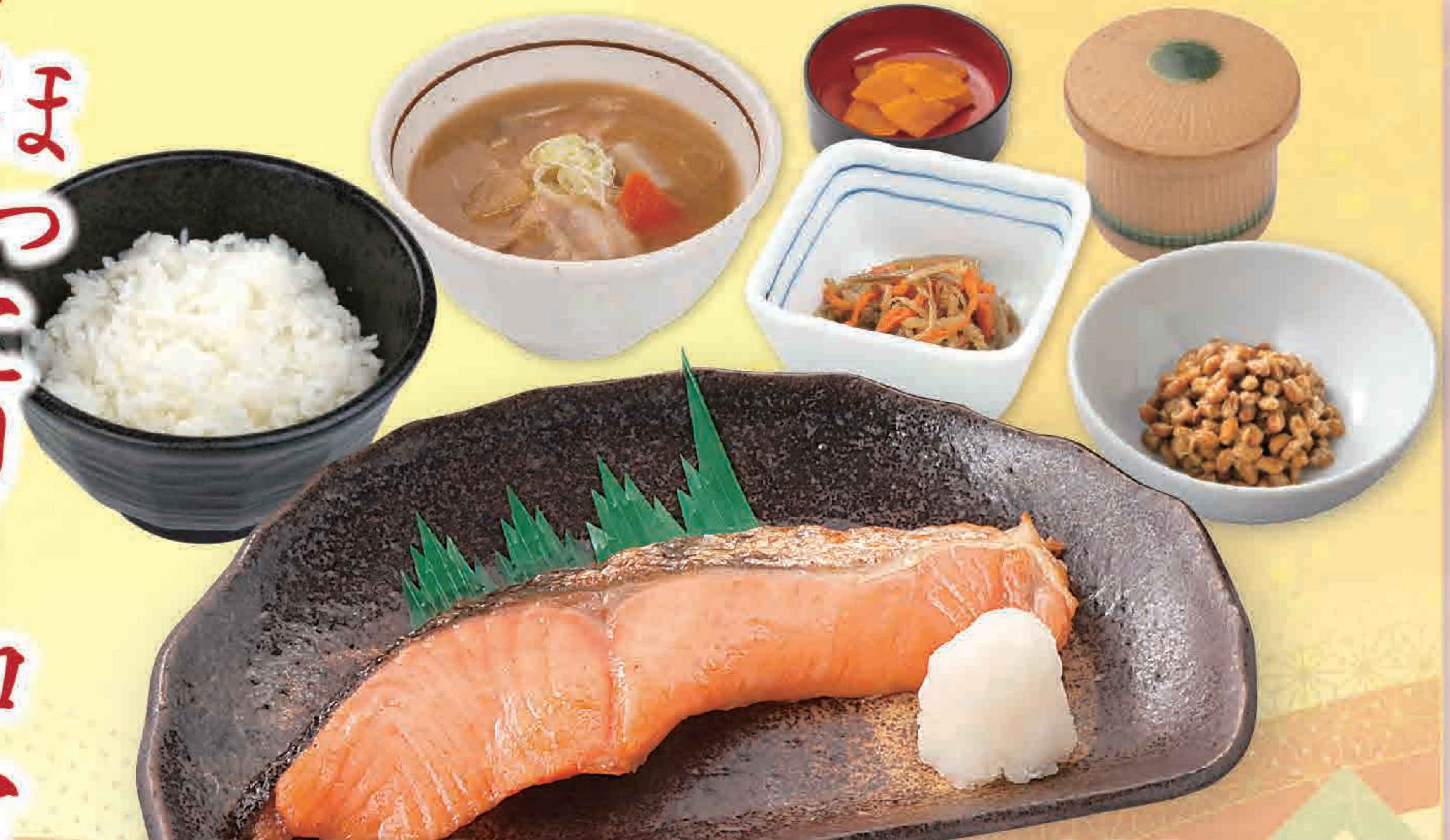
銀鮭定食 741kcal/塩分6.7g 928円 ●焼き銀鮭、ご飯、とん汁、茶碗蒸し、小鉢、納豆、お新香 (税込1,020円)