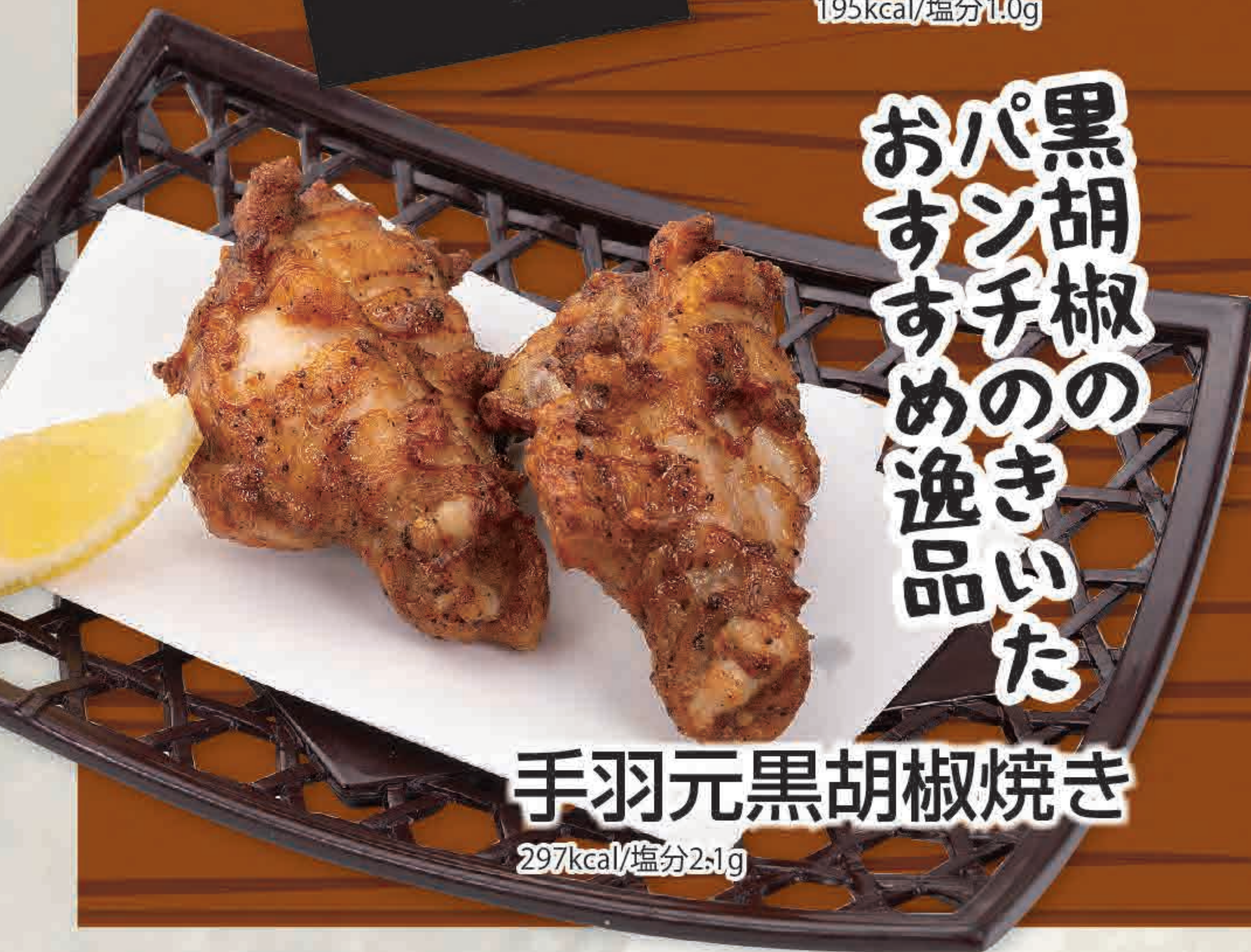
手羽元黒胡椒焼き 297kcal/塩分2.1g