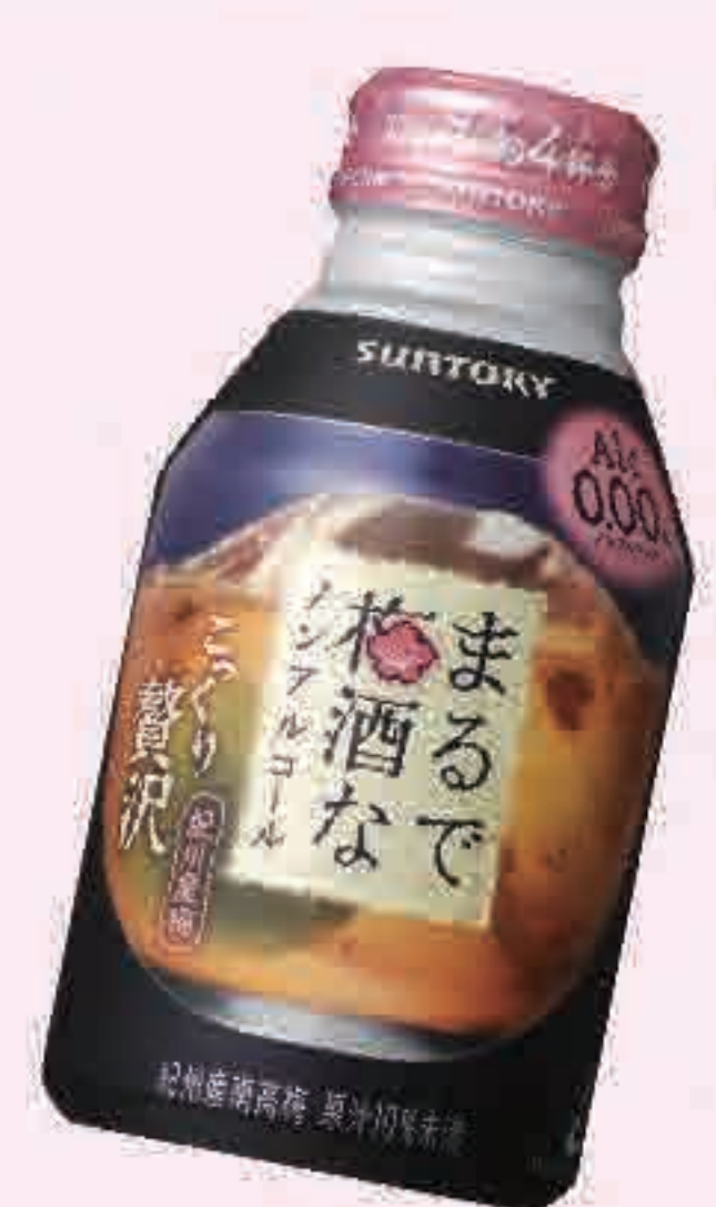
ノンアル梅酒 364円 (税込400円)