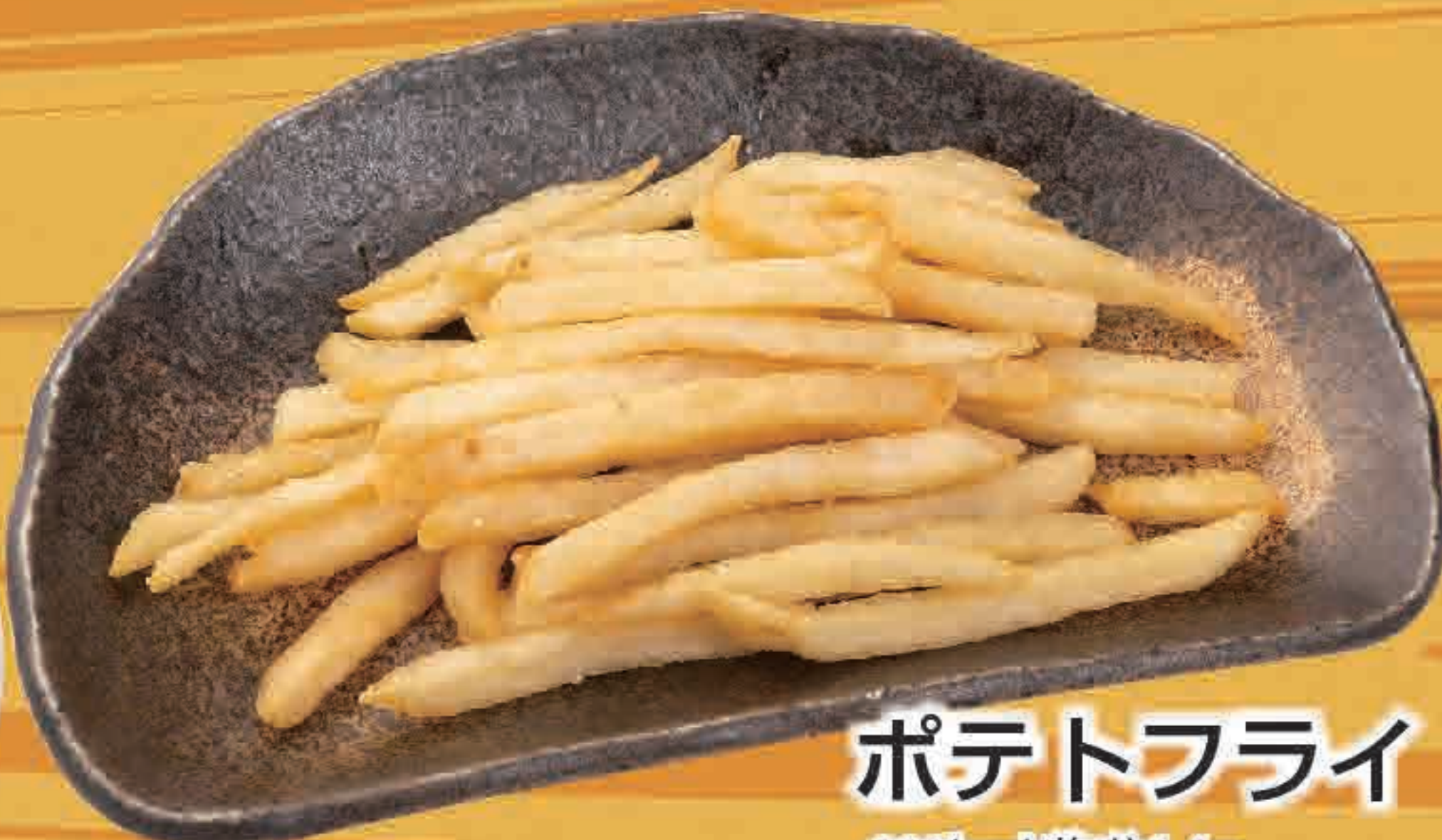
ポテトフライ 233kcal/塩分1.4g