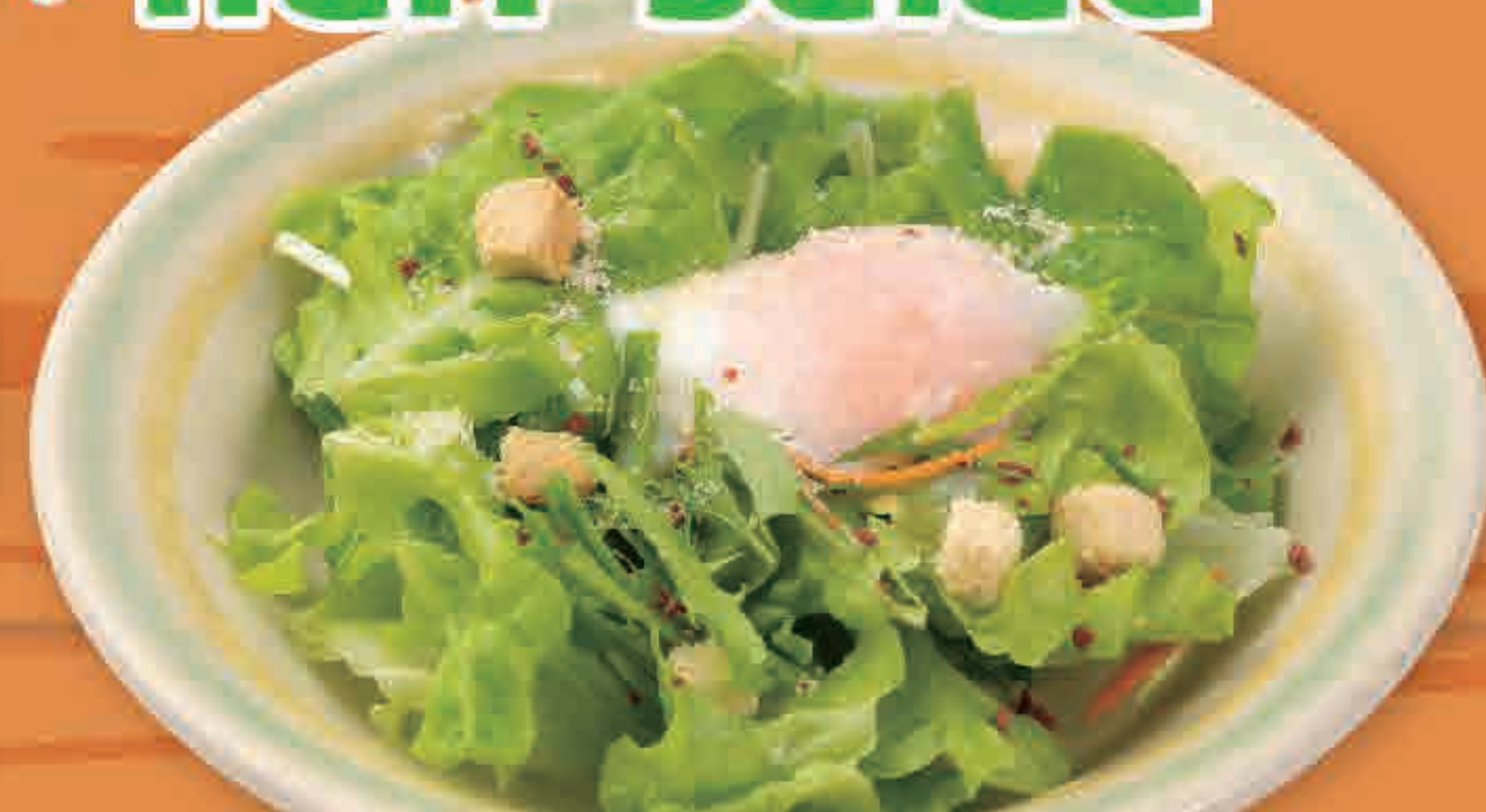
ハーフシーザーサラダ 199kcal/塩分1.1g