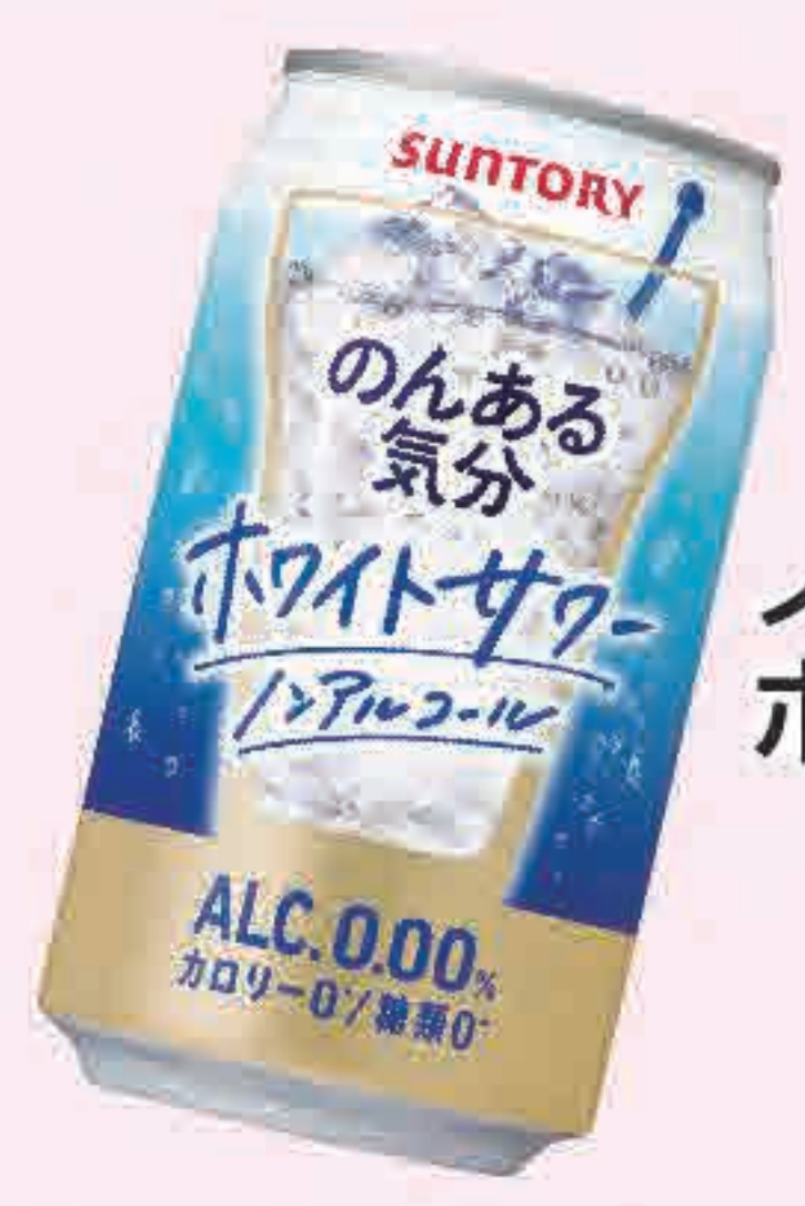
ノンアル ホワイトソーダ 273円 (税込300円)