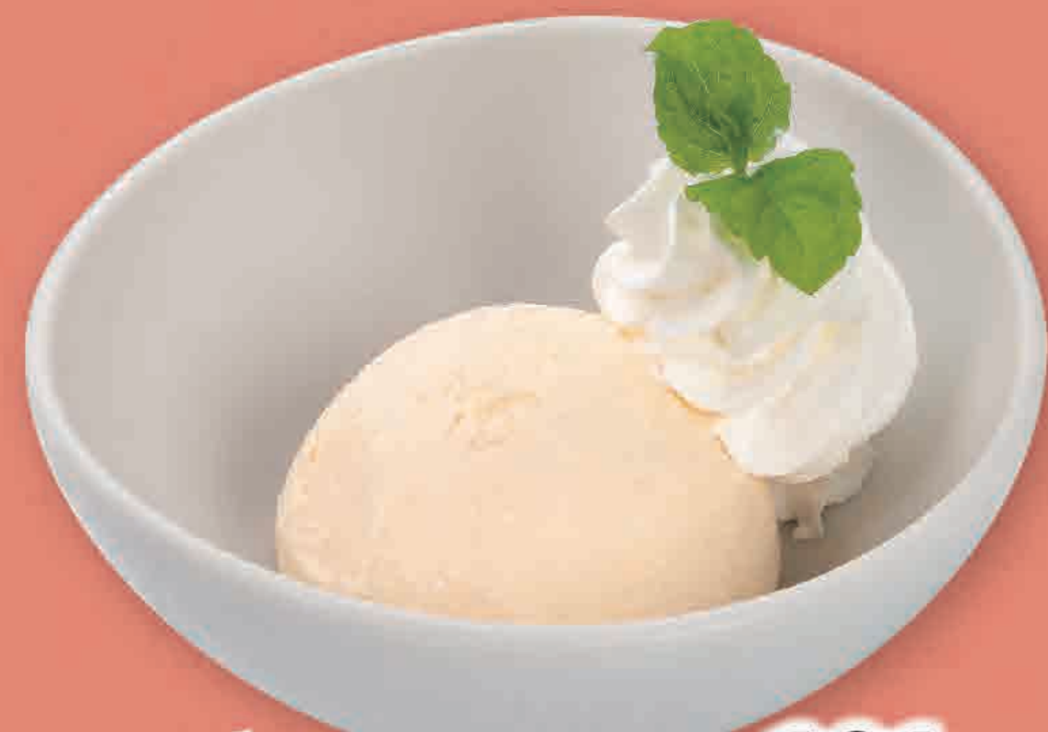
バニラアイス 191円 93kcal/塩分0.0g (税込210円)