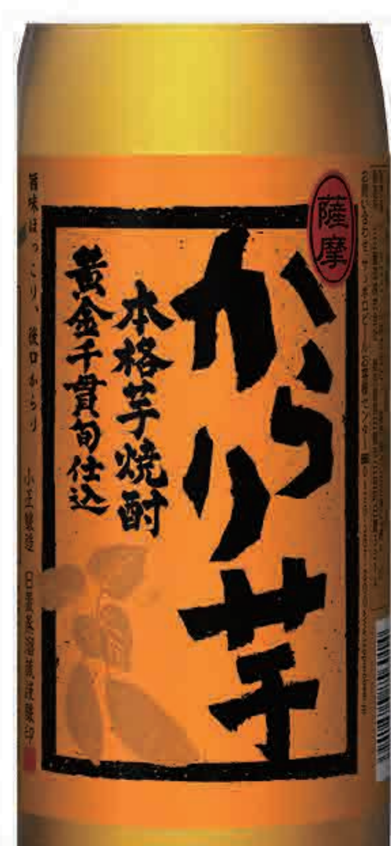
いも焼酎 からり芋 (グラス) 437円 (税込480円) (ボトル) 2,728円 (税込3,000円)