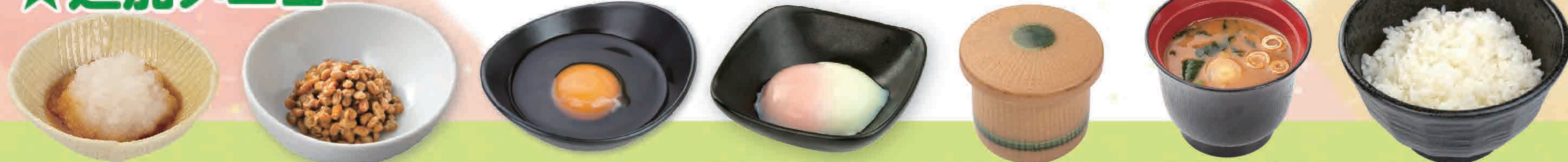
おろしポン酢 110円 (税込120円) 33kcal/塩分1.7g 納豆 64円 (税込70円) 89kcal/塩分0.7g 生卵 64円 (税込70円) 99kcal/塩分0.3g 温泉玉子 73円 (税込80円) 85kcal/塩分0.2g 茶碗蒸し 128円 (税込140円) 57kcal/塩分0.9g みそ汁 64円 (税込70円) 20kcal/塩分1.6g ご飯 128円 (税込140円) 312kcal/塩分0.0g