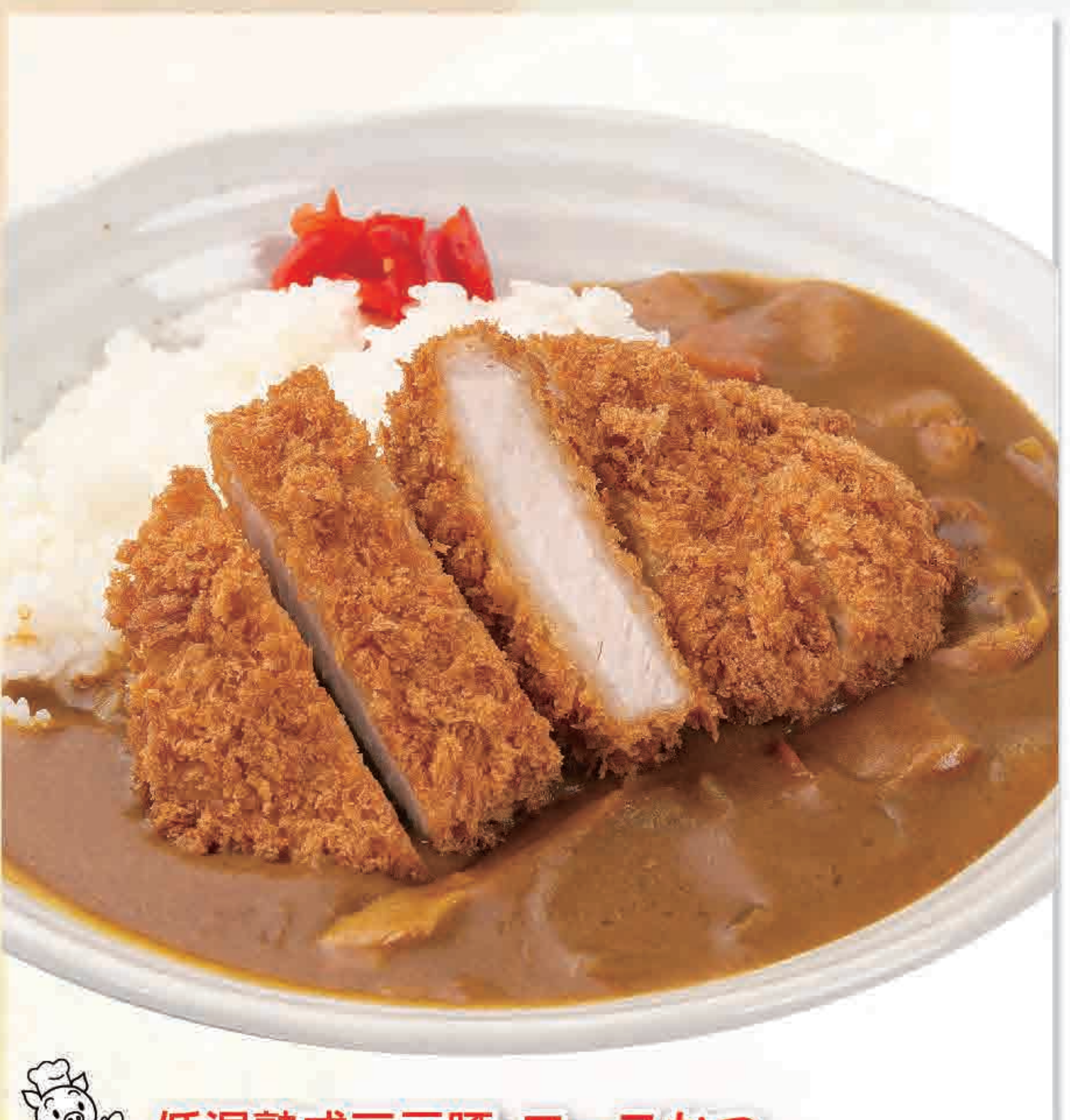
低温熟成三元豚・ローズかつ かつカレー 955円 1,072kcal/塩分4.8g (税込1,050円)