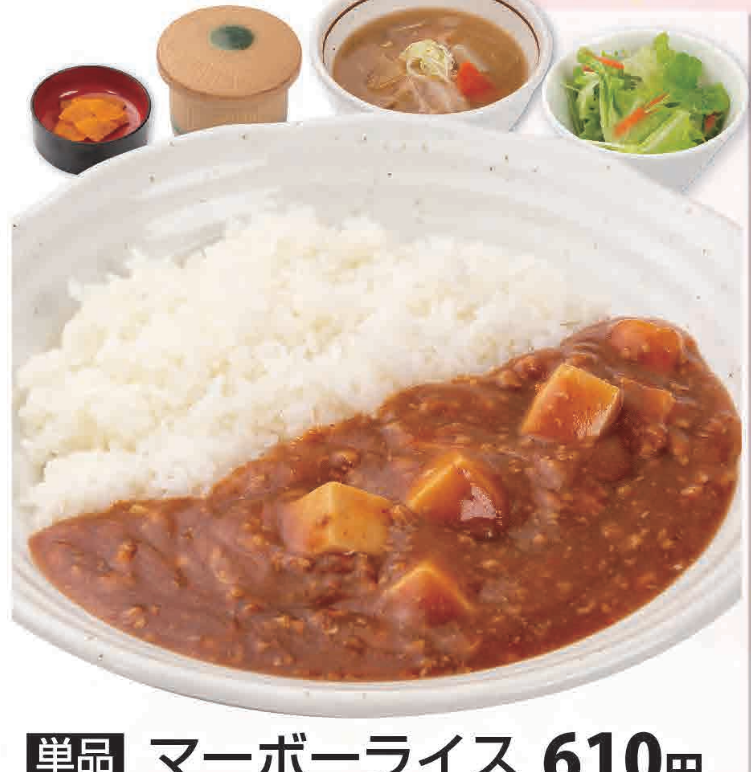
单品 マーボーライス 610円 579kcal/塩分3.7g (税込670円)