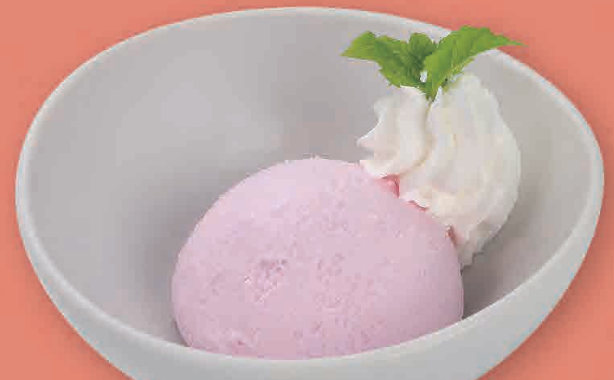
ストロベリーアイス 191円 92kcal/塩分0.0g (税込210円)