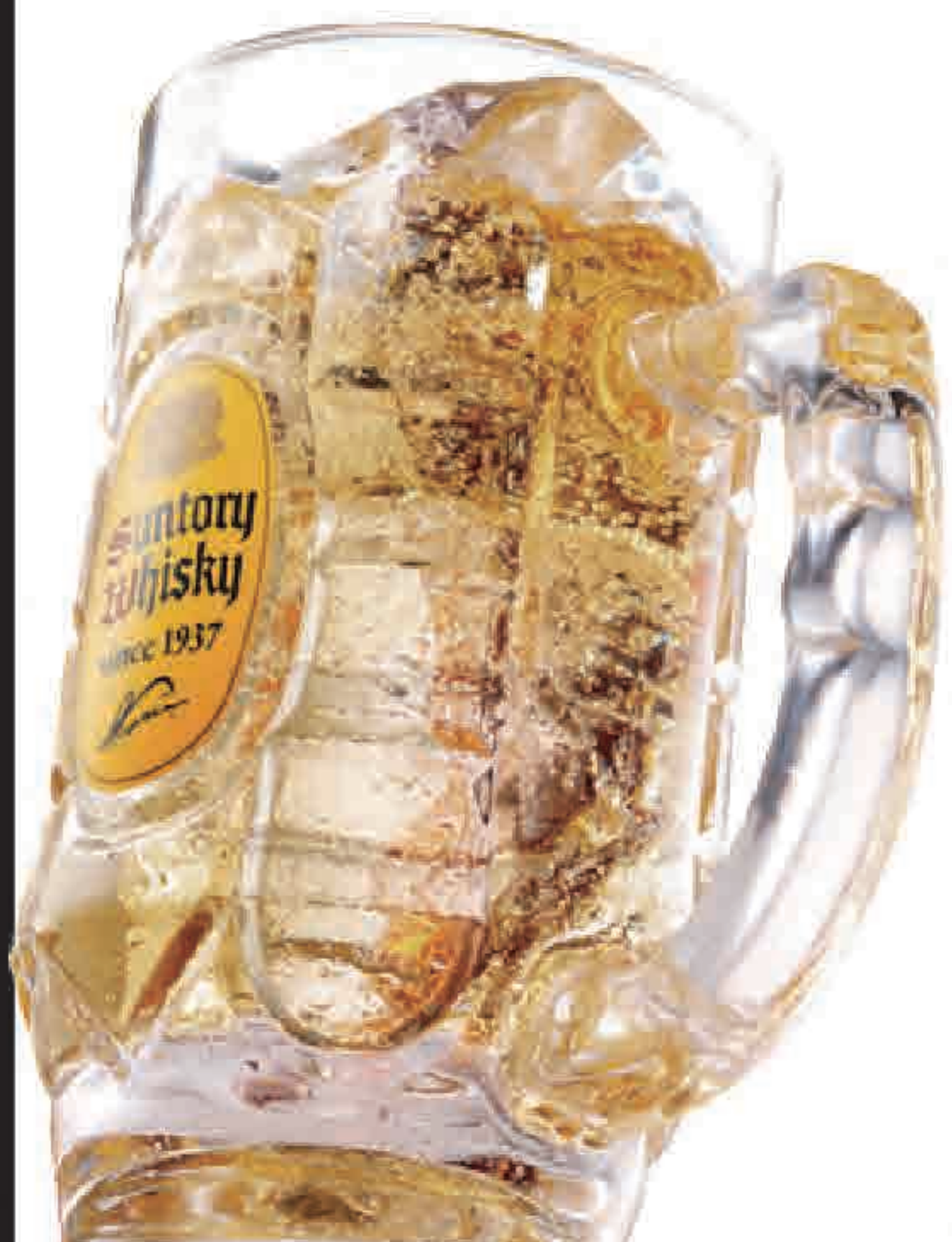
角ハイボール 364円 (税込400円)