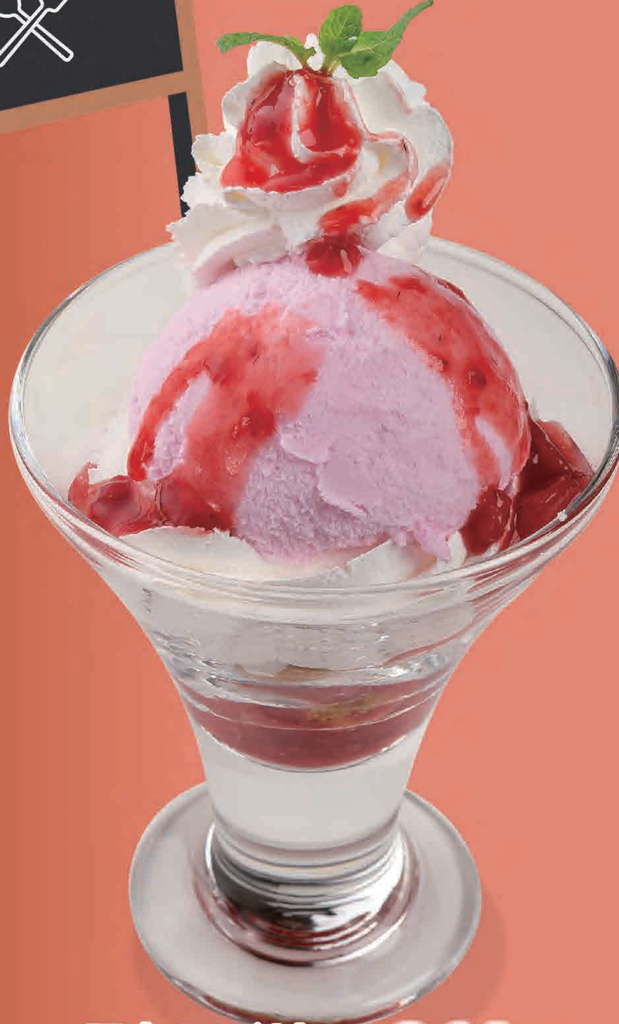
ストロベリー サンデー 364円 (税込400円) 218kcal/塩分0.2g