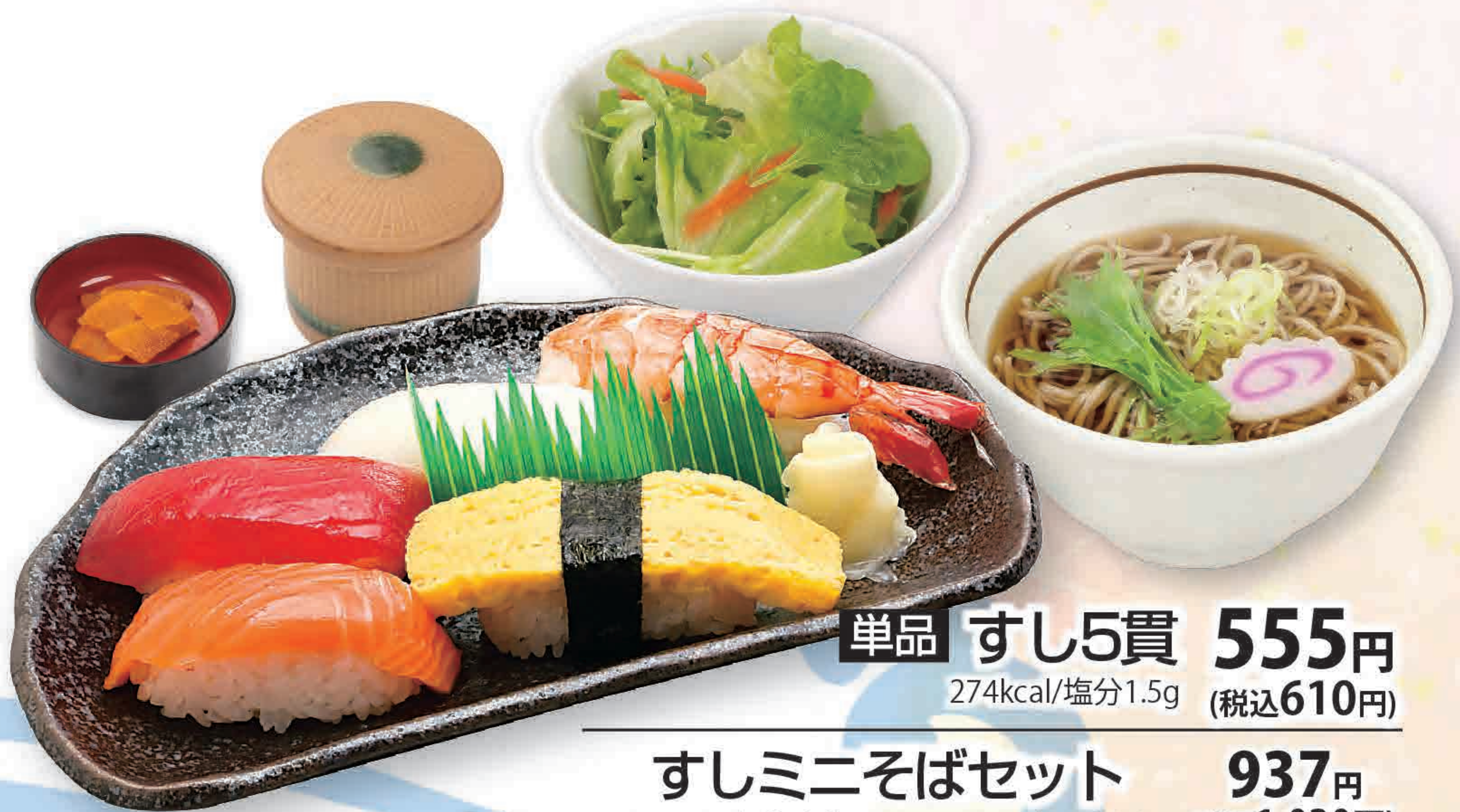
单品 すし5貫 555円 274kcal/塩分1.5g (税込610円)