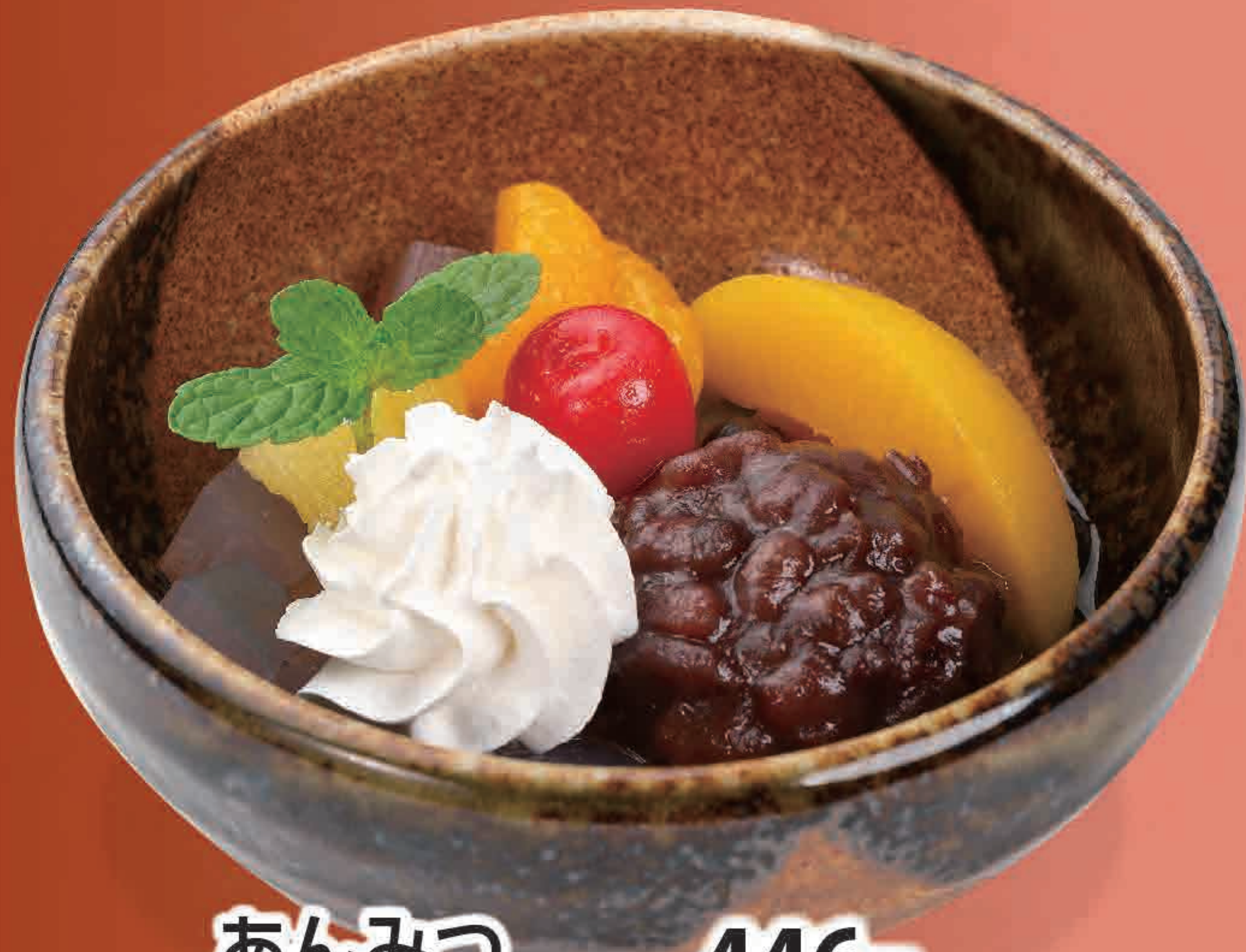
あんみつ 446円 (税込490円) 297kcal/塩分0.2g