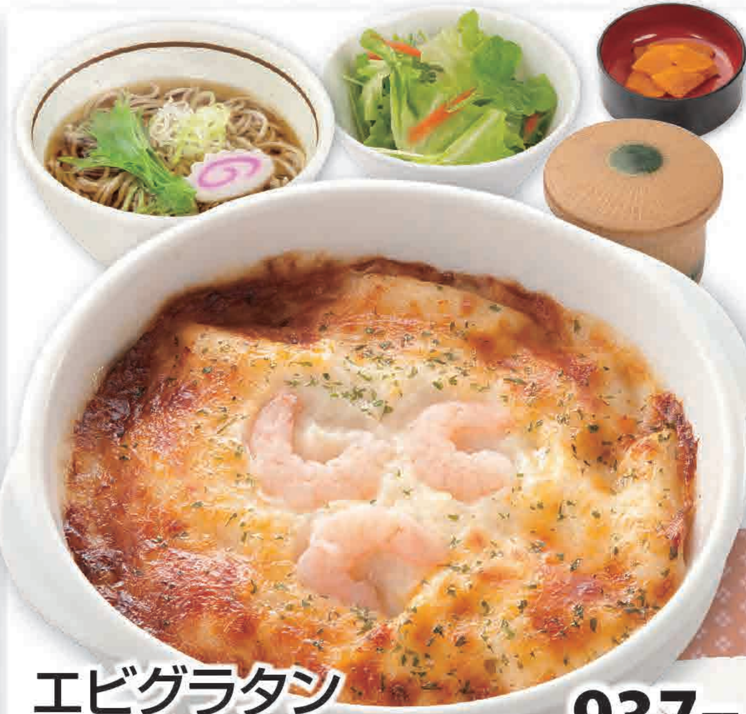
エビグラタン ミニそばセット 937円 (税込1,030円)