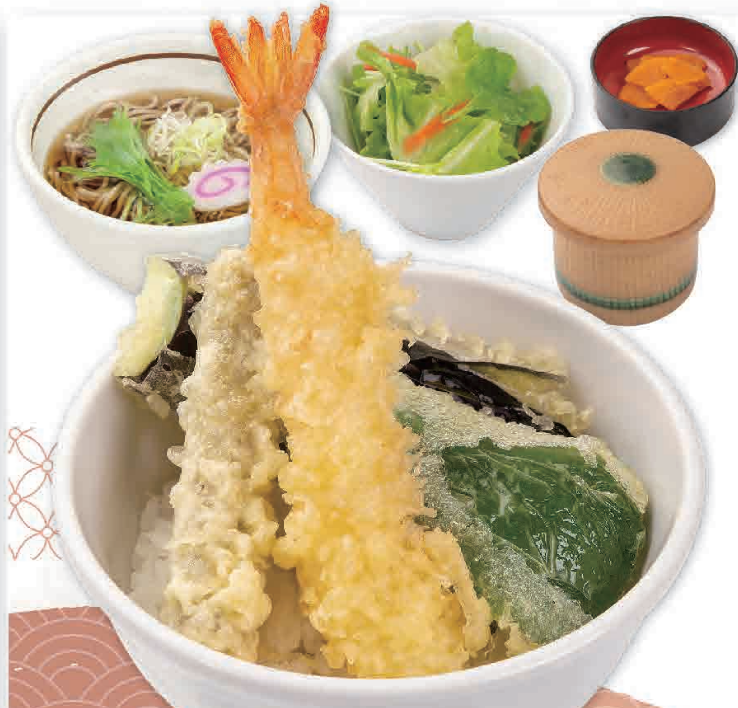
ミニ天丼 ミニそばセット 828円 (税込910円)