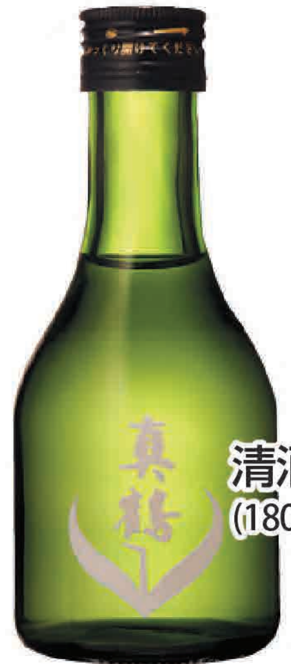
清酒 真鶴 (180ml) 473円 (税込520円)