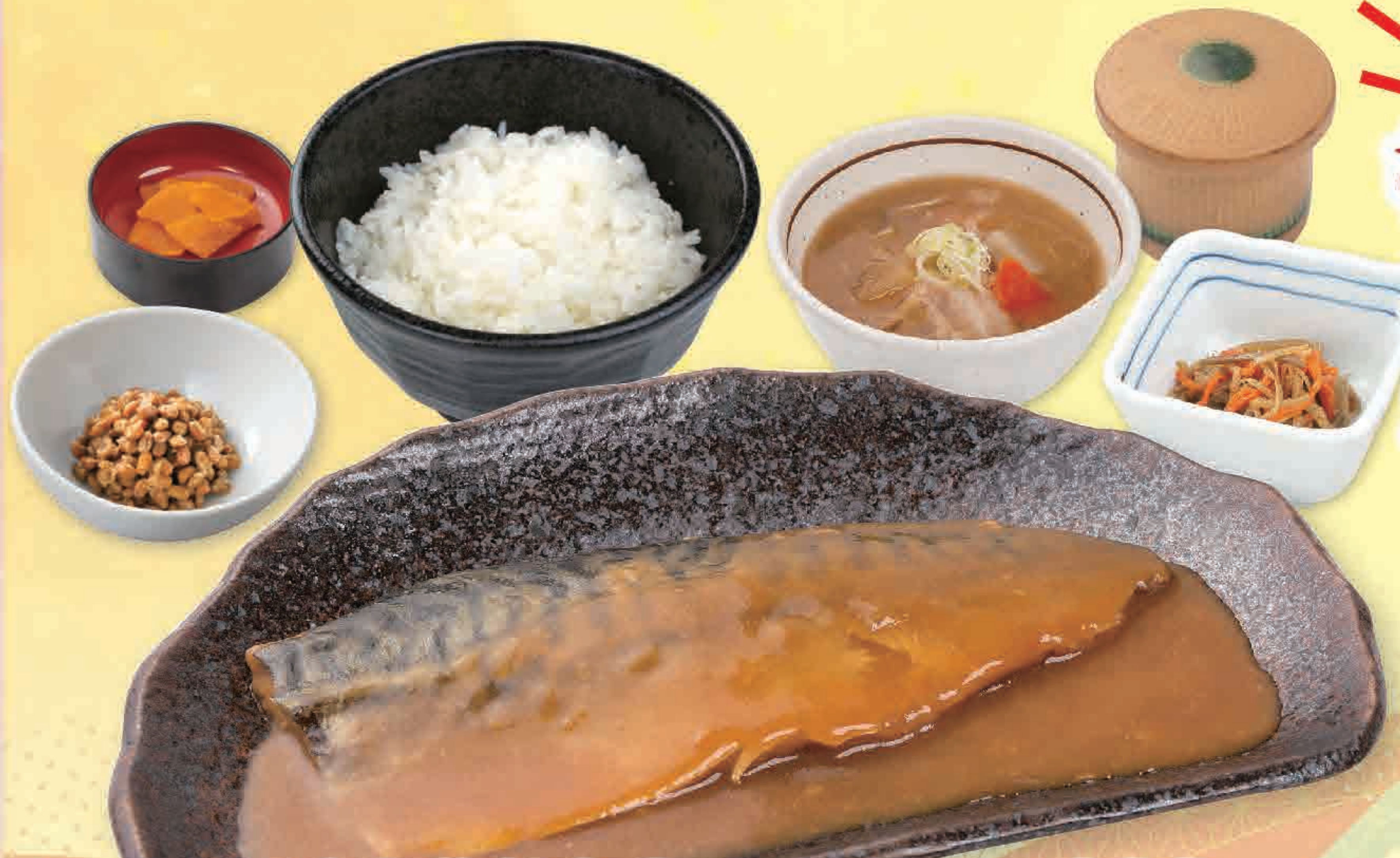
さば味噌煮定食 947kcal/塩分6.5g 928円 ●さば味噌煮、ご飯、とん汁、茶碗蒸し、小鉢、納豆、お新香 (税込1,020円)