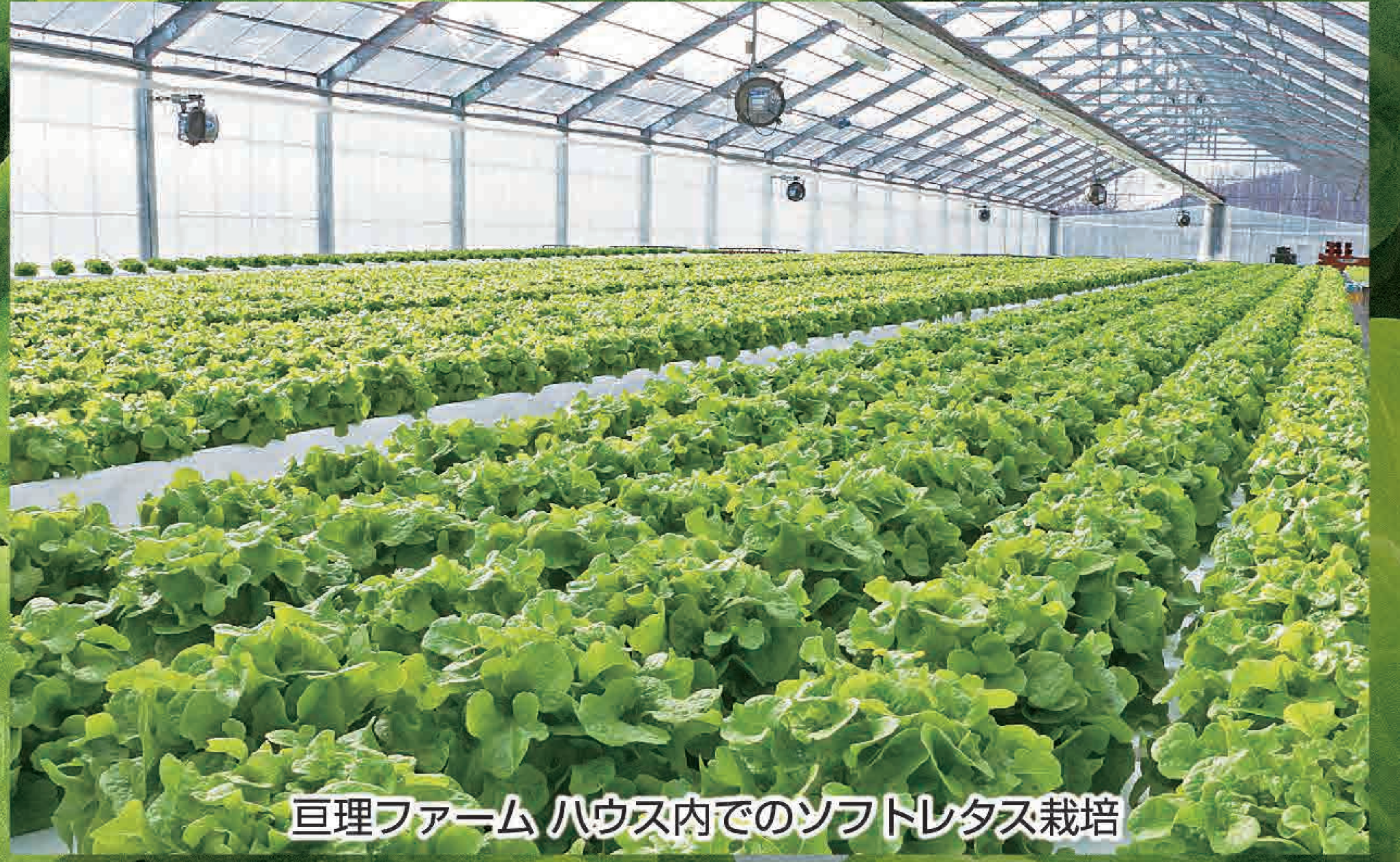
巨理ファーム ハウス内でのソフトレタス栽培