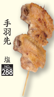
手羽先 塩 NO. 288