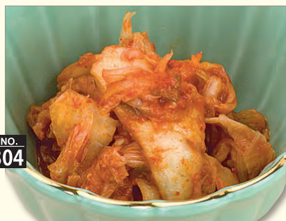
NO. 304 自家製キムチ 三九〇円 (税別)