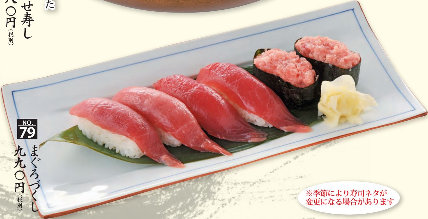
NO. 79 まぐろづくし 九九〇円 (税別)