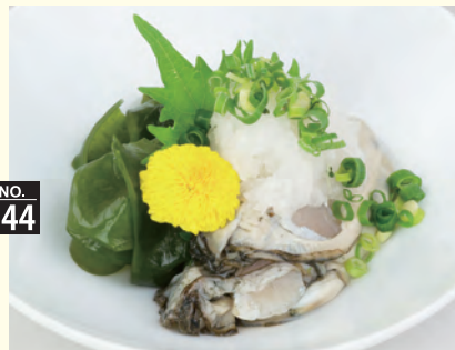
大根おろしと自家製ポン酢でさっぱりと