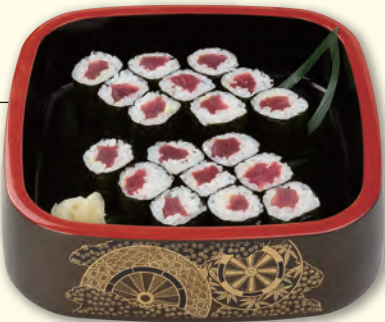
NO. 319 鉄火巻き 九〇〇円 (税別)