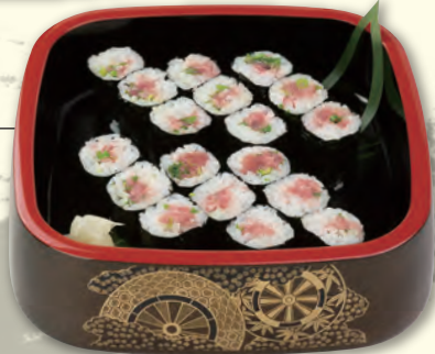
NO. 323 ネギトロ巻き 八〇〇円 (税別)