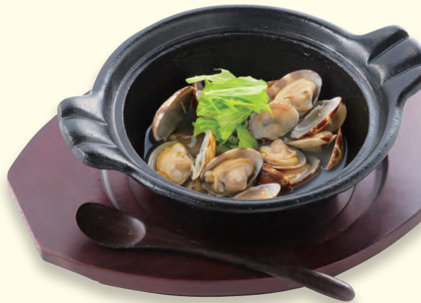
あさりの旨みをたっぷりと