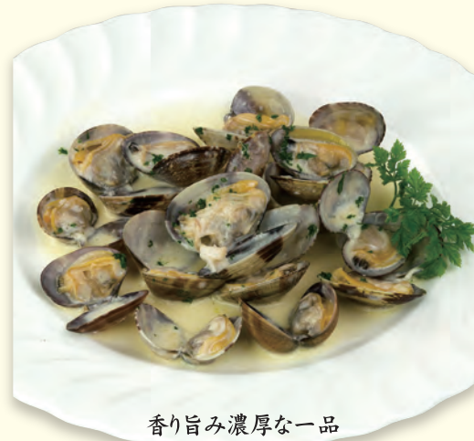
香り旨み濃厚な一品