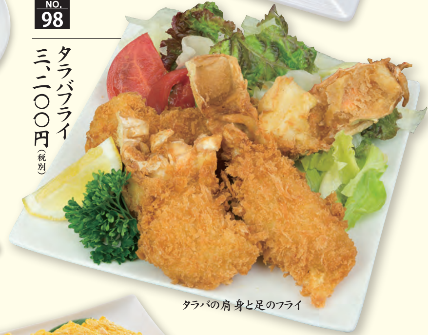
NO. 98 タラバフライ 三、二〇〇円(税別)