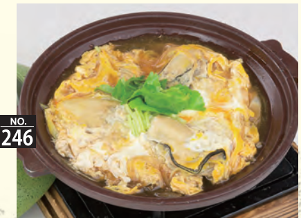
NO. 246 カキの柳川風 六七〇円(税別)