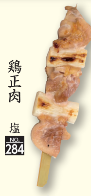
鶏正肉 塩 NO. 284