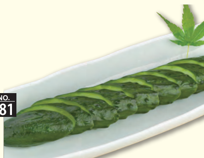
NO. 181 きゅうり一本漬け 三九〇円 (税別)