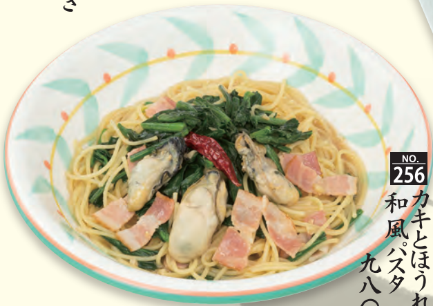
しょうゆベースの和風味