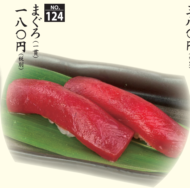
NO. 124 まぐろ(二貫) 一八〇円(税別)