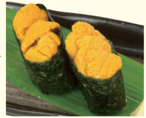
NO. 146 うに(二貫) 五八〇円(税別)