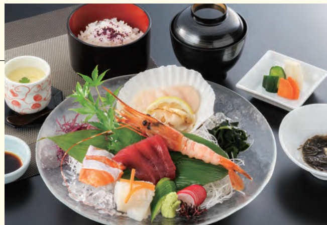
刺身・小鉢・茶碗蒸し・ご飯・汁物・香の物