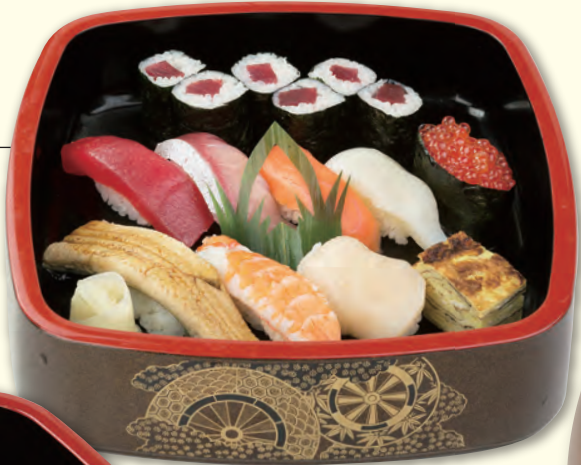
NO. 315 竹寿司 一、七八〇円 (税別)