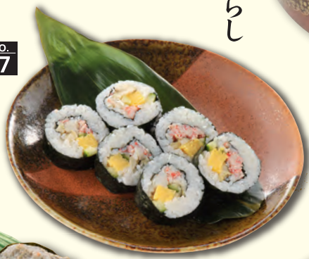
NO. 87 かに太巻き寿司 八〇〇円(税別)