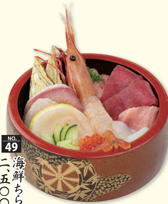
NO. 49 海鮮ちらし 二、五〇〇円(税別)