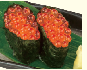
NO. 135 いくら軍艦(二貫) 二五〇円(税別)