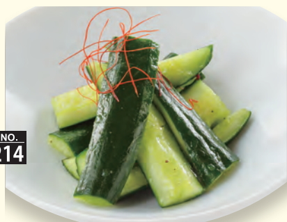
NO. 214 叩き胡瓜 三九〇円 (税別)