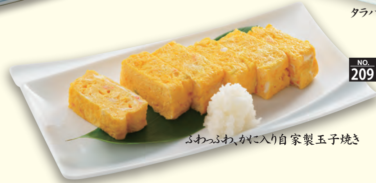
NO. 209 かに入り出し巻き玉子 六九〇円(税別) ふわふわ、かに入り自家製玉子焼き