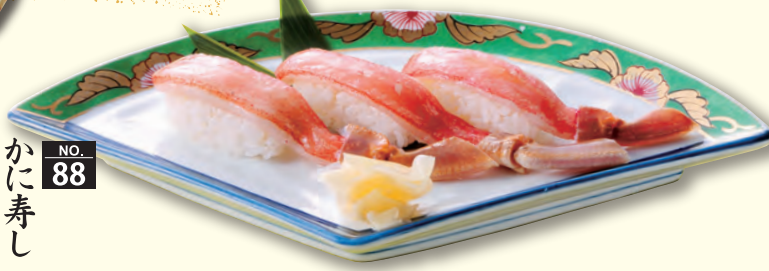
NO. 88 かに寿司 一、二五〇円(税別)