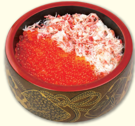
NO. 46 かにいくらちらし 一、九八〇円(税別)