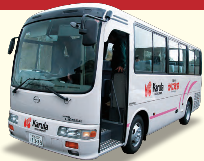
2018-12 GM-HONCHO Bp(T-i)