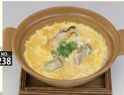
カキのだしがよく出ます