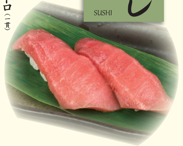
NO. 173 まぐろトロ(二貫) 三八〇円(税別)