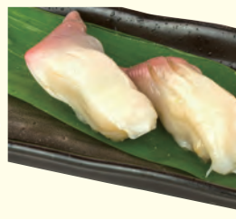
NO. 148 活ほつき(二貫) 四八〇円(税別)