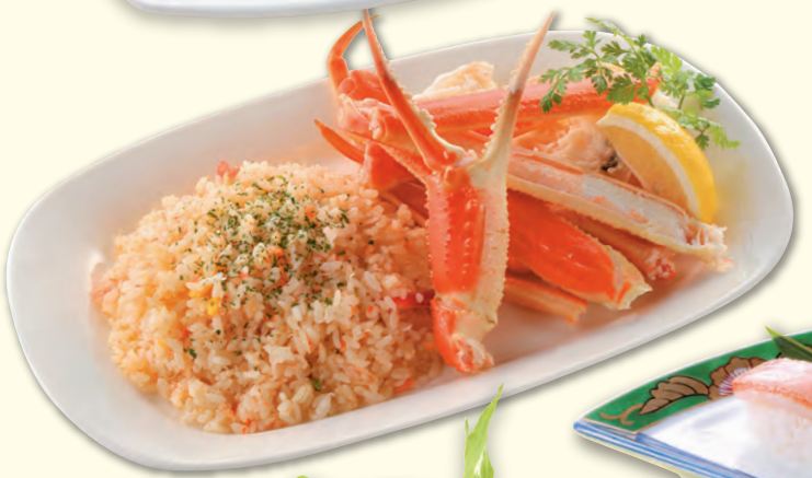
NO. 67 かにピラフ 一、五〇〇円(税別)