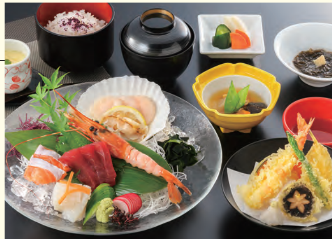
刺身・天ぷら・小鉢・煮物・茶碗蒸し・ご飯・汁物・香の物