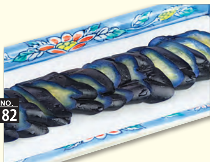
NO. 182 長なす漬け 三九〇円 (税別)