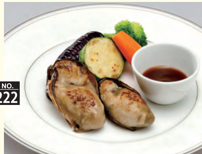
カキのバター焼き 野菜をそえて