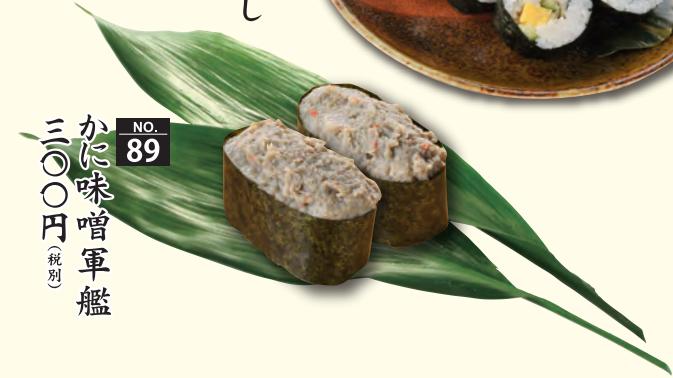
NO. 89 かに味噌軍艦 三〇〇円(税別)