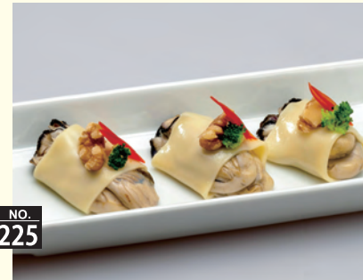
NO. 225 カキのチーズ巻き 六八〇円(税別)