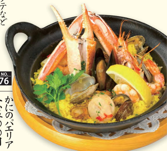
贅沢に新鮮魚介のパエリア