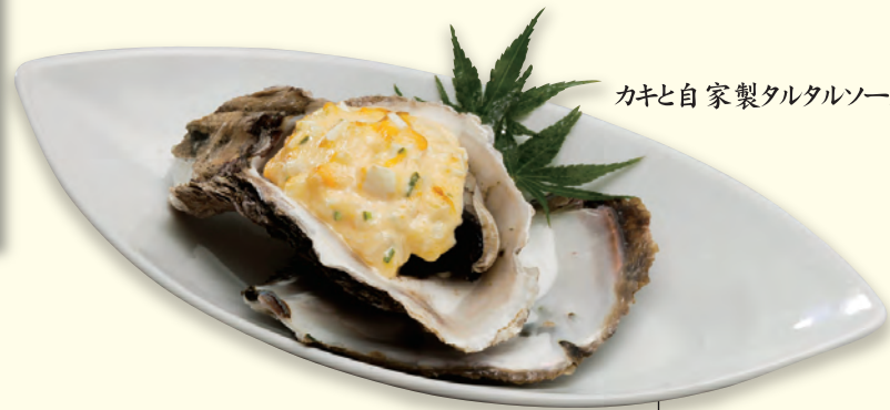
カキと自家製タルタルソースの相性最高!