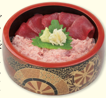
NO. 48 まぐろ・ネギトロちらし 一、四八〇円(税別)