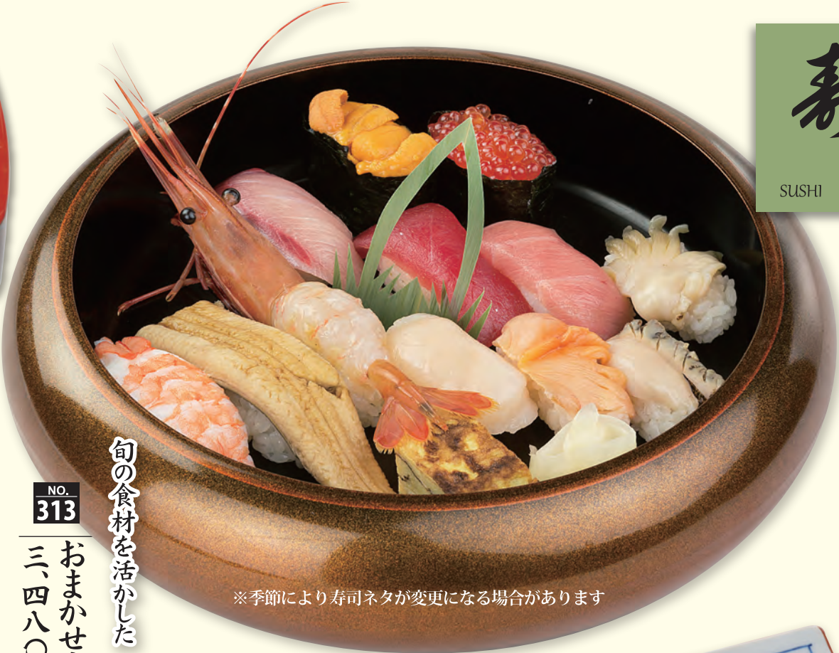
NO. 313 おまかせ寿司 三、四八〇円 (税別)