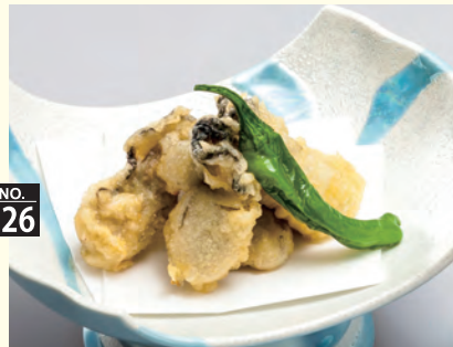
プリッとしたカキの天ぷら