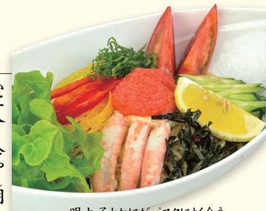
明太子とかにがパスタによく合う