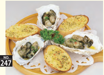
NO. 247 カキのエスカルゴ風 六七〇円(税別)