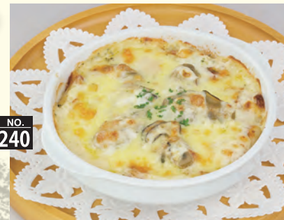
NO. 240 カキの和風ドリア 八八〇円(税別)