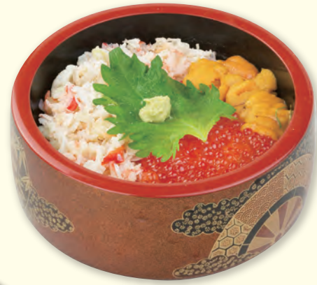
NO. 47 うに・かに・イクラちらし 二、五八〇円(税別)