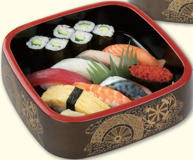
NO. 317 梅寿司 一、〇八〇円 (税別)