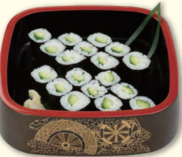
NO. 321 かつば巻き 六〇〇円 (税別)