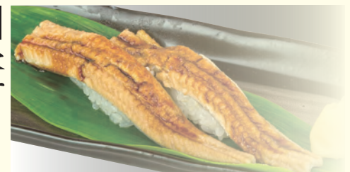
NO. 187 穴子(二貫) 四八〇円(税別)