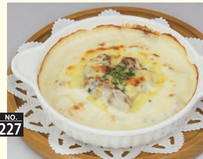
NO. 227 カキグラタン 八八〇円(税別)