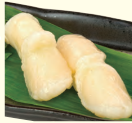
NO. 157 活ほたて(二貫) 六〇〇円(税別)