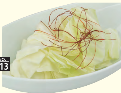
NO. 213 塩だれキャベツ 三九〇円 (税別) キャベツの甘みを、さっぱりシャキシャキ