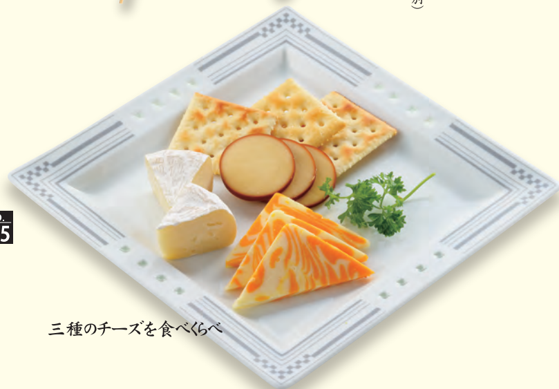
三種のチーズを食べくらべ