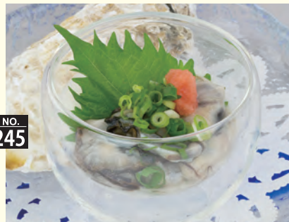
長芋と自家製ポン酢の相性抜群