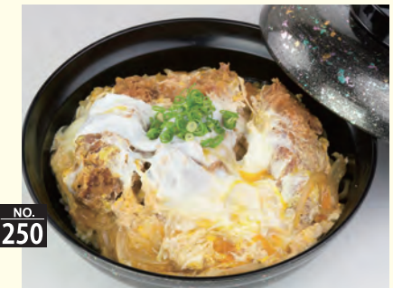
NO. 250 カキフライとじ井 九八〇円(税別)