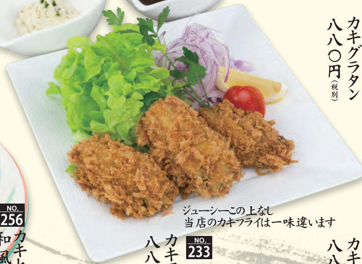
ジューシーこの上なし 当店のカキフライは一味違います