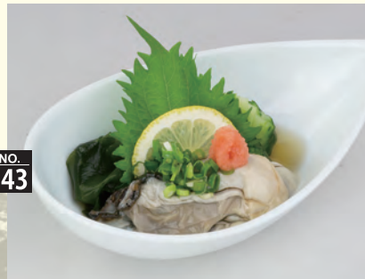
酸味をおさえた、自家製ポン酢でどうぞ