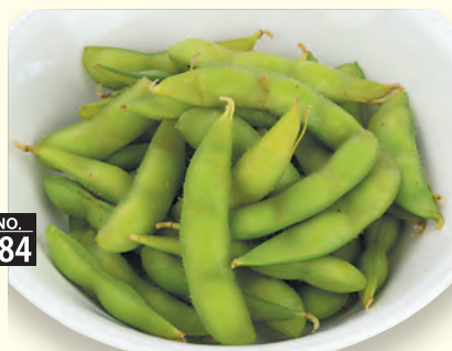
NO. 184 枝豆 二九〇円 (税別)