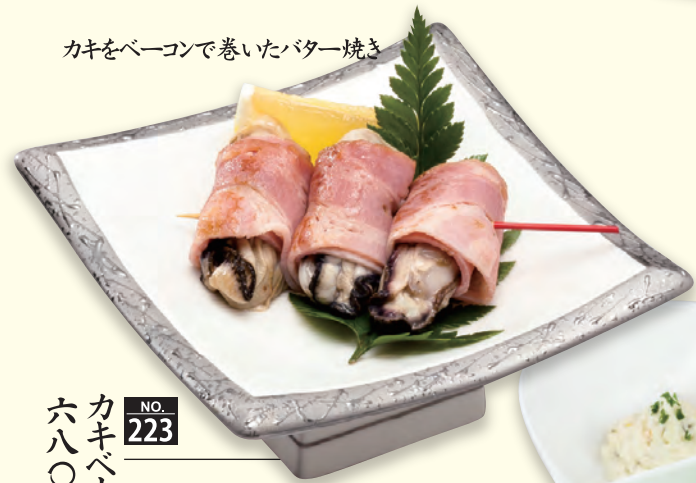
カキをベーコンで巻いたバター焼き