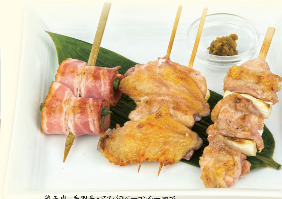
鶏正肉、手羽先・アスパラベーコンを一皿で